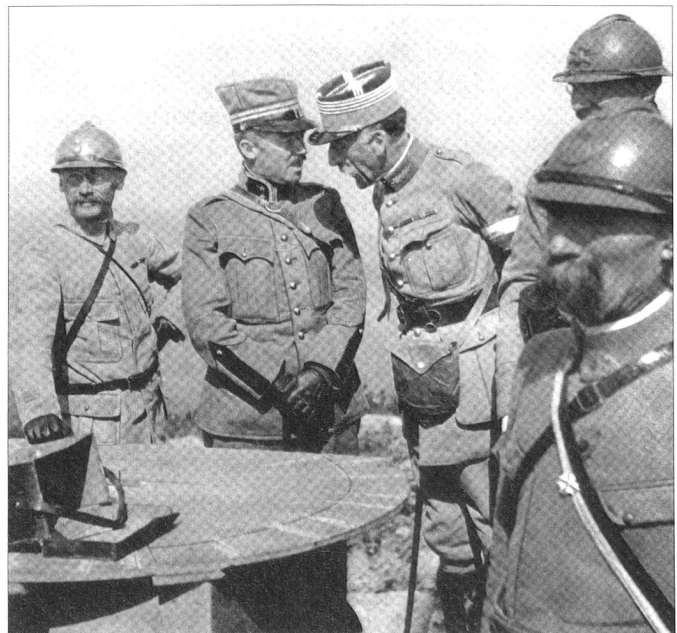
Visite de Guisan sur le front de Verdun en 1916.