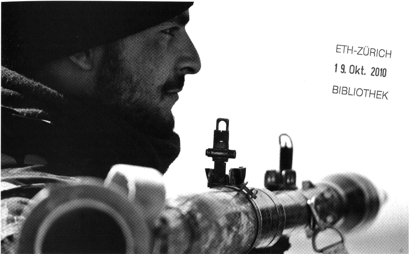
Le RPG-7 est une arme simple aujourd'hui, mais ses projectiles disposent de technologies de premier plan.

l'abnégation des insurgés, ne parviennent pas à secouer le joug de l'occupant, de l'agresseur ou simplement de l'adversaire conventionnel.