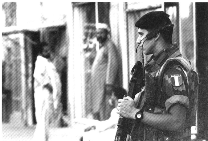
Ce soldat français à Kaboul rappelle que les opérations modernes doivent agir à la fois sur les adversaires et sur les populations concernées.

d'épingle et quelques coups de bélier promet d'en venir à bout rapidement – surtout lorsque les coups d'épingle deviennent des coups d'épée qui plongent au cœur du dispositif adverse, ce que permettent les moyens de locomotion et de communication modernes 10 .