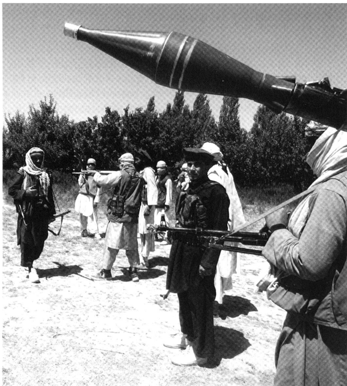
Le Taliban est présenté aujourd'hui comme un combattant rustique, insaisissable et invincible.