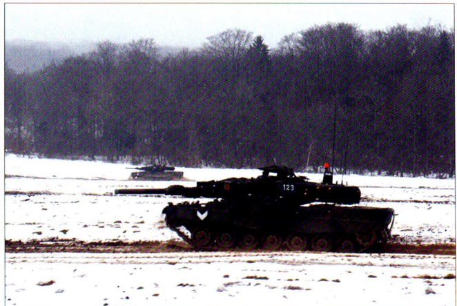
Chaque jour durant la 2 e semaine, deux compagnies ont accompli chacune 3 exercices de compagnie.