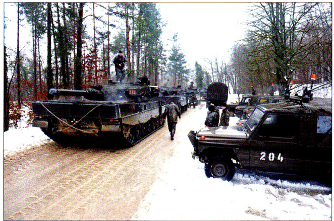
6.12.2010 : La cp chars 17/1 se rassemble pour la critique.