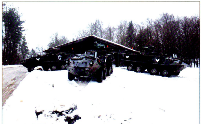
La compagnie état-major, elle aussi en exercice, fournit l'infrastructure pour les critiques d'exercice dans le terrain.