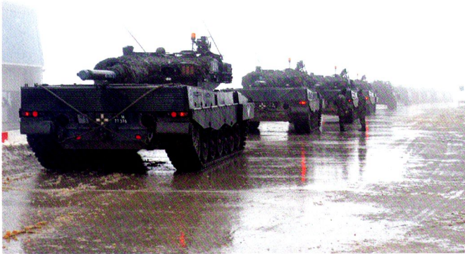
La cp chars 17/4, renforcée d'une section de chars de la 17/2, encolonnée et prête pour le début de l'exercice.

Comme les lames des patins sur la glace, comme le balai aérien de la Patrouille suisse, les chars exécutent leur chorégraphie dans la brume matinale de la place d'armes de