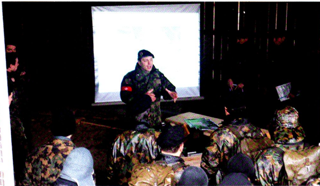
Debriefing d'un exercice par le cdt bat.