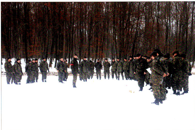
Debriefing intermédiaire d'un exercice de la cp gren chars 17/4 (+) sur une maquette de terrain.

Si ce déroulement paraît simple en théorie, il est le fruit d'une longue réflexion et de longues heures de planification en amont. L'état major du bataillon a, en effet, passé un temps considérable à la mise sur pied d'une telle manœuvre.