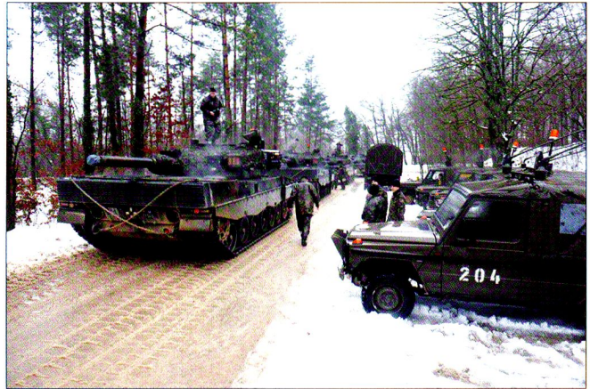
6.12.2010 : La cp chars 17/1 se rassemble pour la critique.