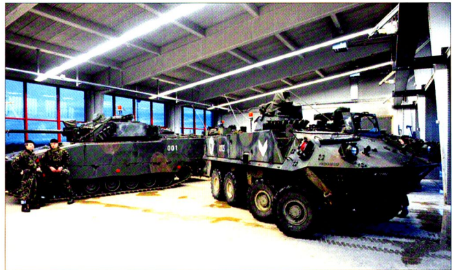
La section échelon de conduite dispose de 5 véhicules blindés et permet des déplacements sûrs et protégés.