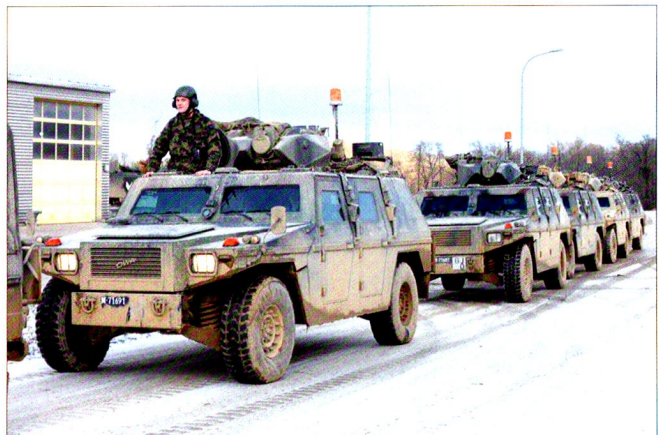
La compagnie dispose également de deux sections d'exploration (photo) et d'une section de transmissions.