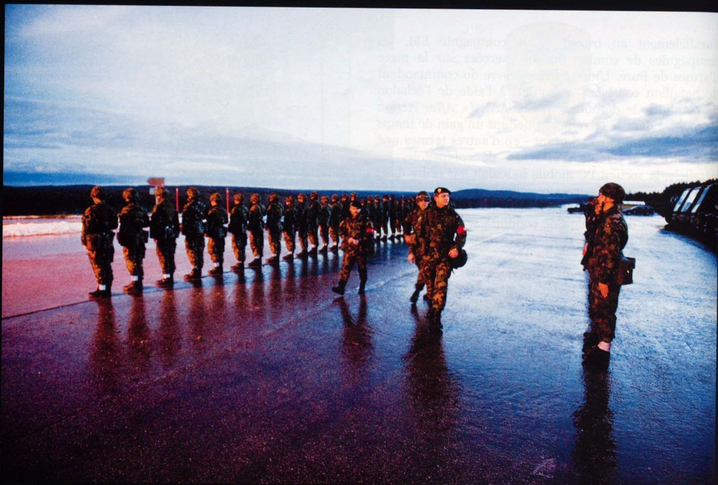
La compagnie EM, inspectée par le cdt bat le 7.12.2010. L'exercice ZULU commence...