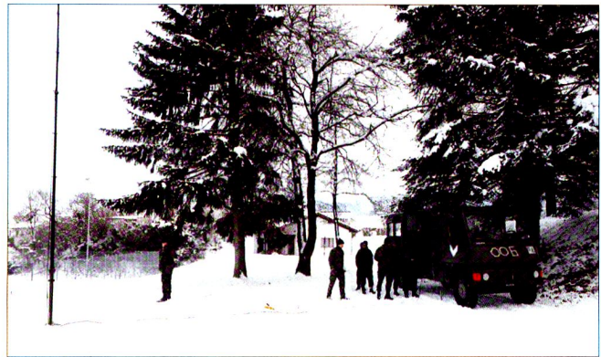
La compagnie d'état-major dispose d'une section PC mobile, qui exploite un poste de commandement dans une infrastructure souterraine, protégée, ou au besoin des maisons.