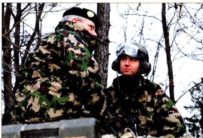
Avant le début de l'exercice, le cdt br bl 1 s'entretient avec le cdt cp.