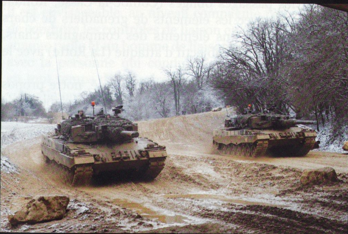
La 17/1 pousse très fort dans Combe la Casse...