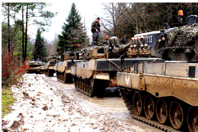
La 17/1 au Bois Abandonné, pour une critique d'exercice.