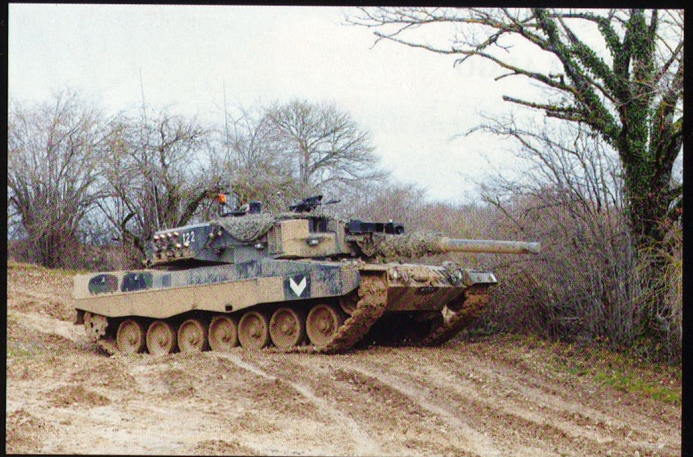
Les chars de la 17/1 observent, avant la poussée.