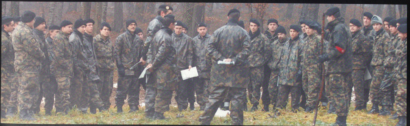
Critique de l'exercice au Bois Abandonné, sur une maquette de terrain.