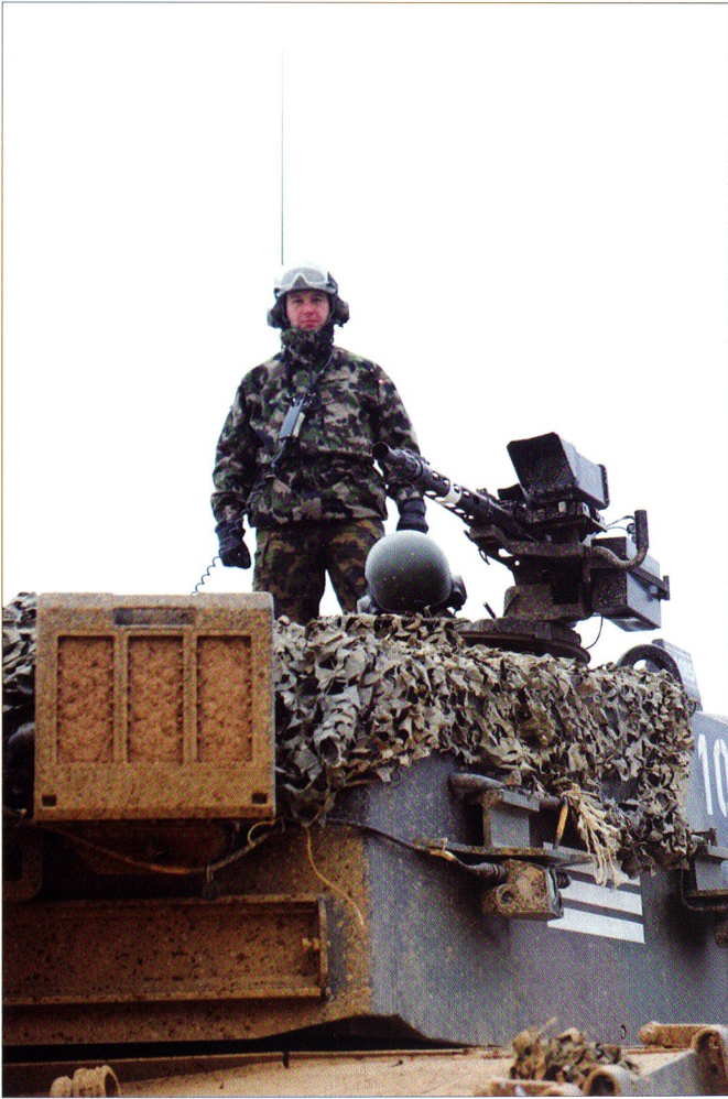
Le cdt cp sur son « bahut. »