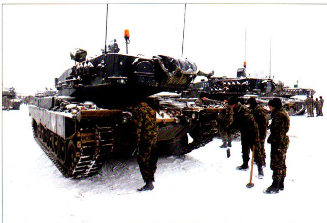
Halte, nouveau but : mettez les crampons à neige...