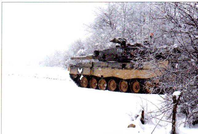
Premières sorties dans la poudreuse...

Le nouvel ordre de bataille de la compagnie de chars présente deux changements importants. Le premier est l'intégration d'une section supplémentaire de logistique, avec des éléments sanitaires et de dépannage ( Büffel ). Le deuxième concerne la formation des sections de combats, qui passe de trois à quatre chars. Malgré cela, la