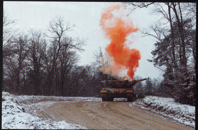
Le char de tête (plt Auffranc) est touché à la sortie de Combe la Casse.