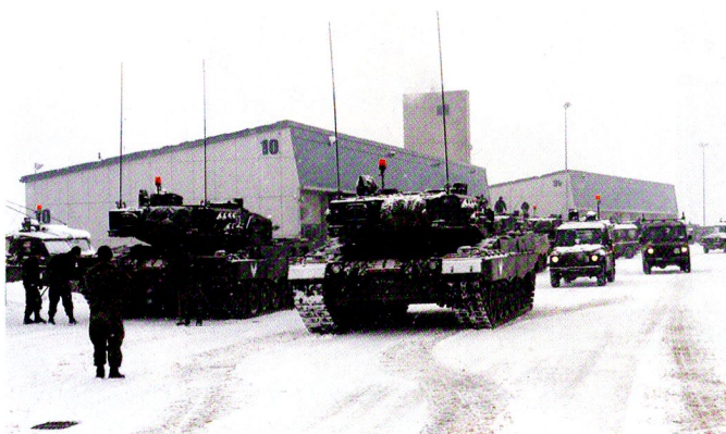
Préparation des véhicules et des simulateurs. Au vu des conditions météo, il faut s'assurer que tout fonctionne.