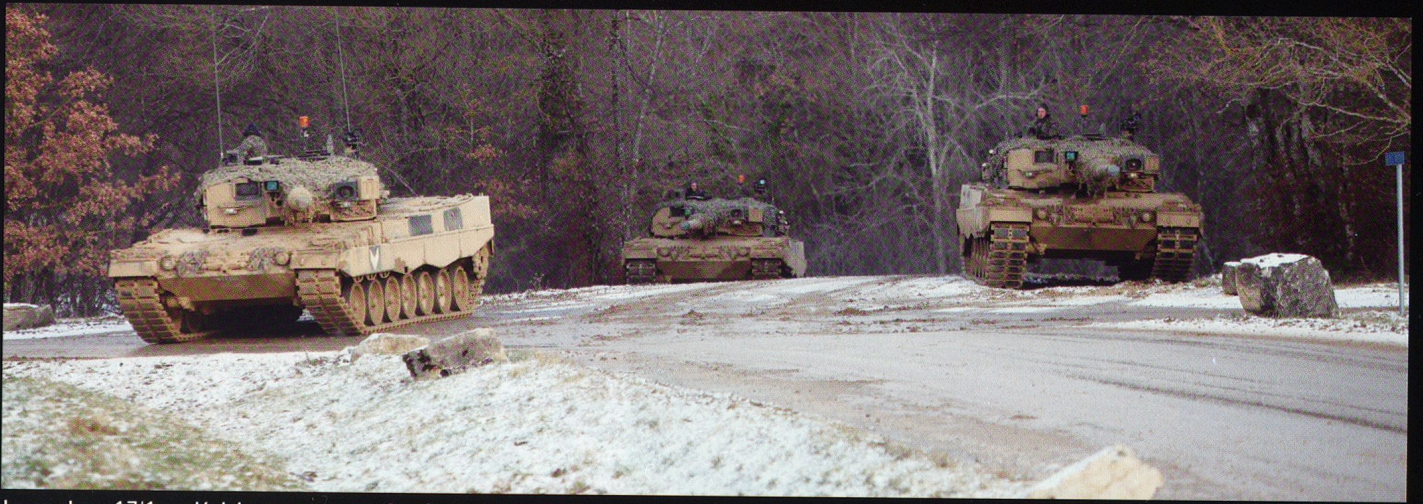
La cp chars 17/1 se déploie et ouvre une tête de pont dans Nalé.