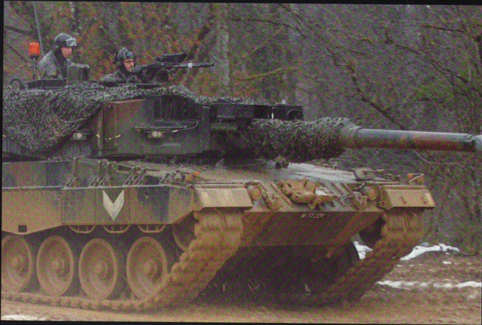
Les chenilles avalent la boue, la neige, ; il faut simplement ajouter des crampons pour la glace... et éviter les routes !