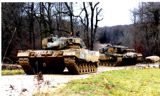
Pas le temps d'être fatigué. Et pas de droit à l'erreur : durant la seconde semaine CR, trois exercices de compagnie par jour donnent la cadence.