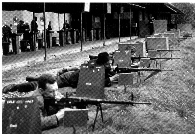
Les militaires sont également astreints, en dehors du service, aux tirs obligatoires annuels et –comme ici– au tir en campagne.

En effet, malgré l'injonction de Francis Fukuyama, l'histoire ne s'est pas arrêtée avec la chute du Mur de Berlin. Indépendamment des réactions émotionnelles des populations européennes, le monde a continué d'évoluer. En particulier, la guerre n'a pas disparu; comme le caméléon elle s'est transformée et, avec son corollaire l'équilibre de la terreur, s'est insinuée à l'intérieur des sociétés, en lieu et place des affrontements entre Etats des siècles précédents. Cette transformation, ce passage de la guerre inter-étatique à la guerre intra-étatique est un des caractères majeurs de la période actuelle[4]. Cela signifie que la confrontation armée ne se déroule plus essentiellement sur le champ de bataille entre unités