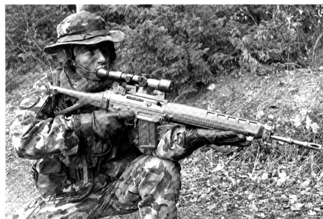
Le fusil d'assaut peut être équipé d'une lunette, pour le tir de précision.