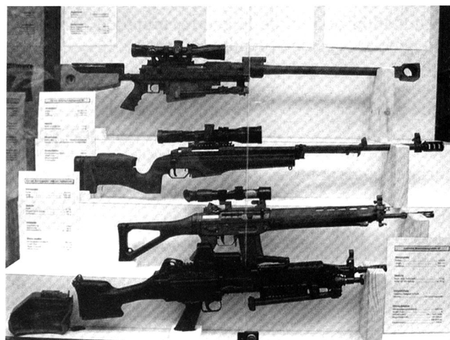
De bas en haut : le fusil-mitrailleur 05 (FM 05 Minimi), le fusil d'assaut 90 à lunette (tiflu), les fusils de précision Sako TRG 42 de 8,6 mm et PGM Hecate II de 12,7 mm.

régulières, mais à l'intérieur même du corps social... au milieu des populations. On vient de le dire, les acteurs de ces combats ne sont plus les armées nationales régulières; ce sont de nouvelles entités telles que les différents groupes armés (ETA, Al Quaida, PKK, FARC, etc.), les mafias et les autres formes de crime organisé, les gangs composés du sous-prolétariat des grandes banlieues urbaines, les anciens services spéciaux de l'ex-bloc soviétique. Contrairement aux armées régulières que l'on peut voir dans leurs casernes ou lors des grands défilés, ces nouveaux acteurs de la guerre restent généralement