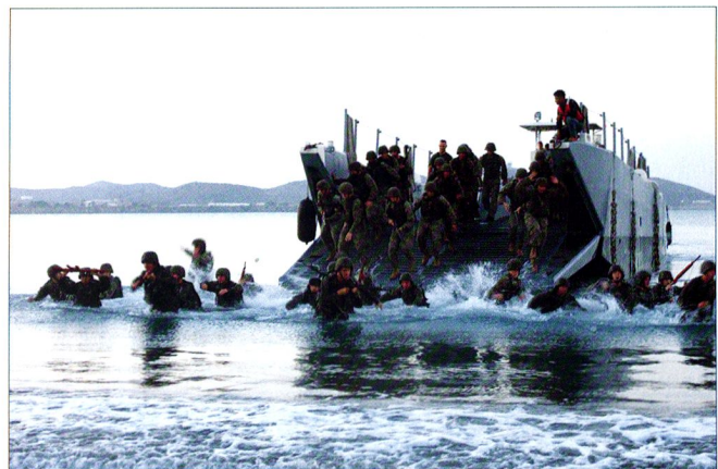
La méthode traditionnelle et lente du débarquement est le LCU.