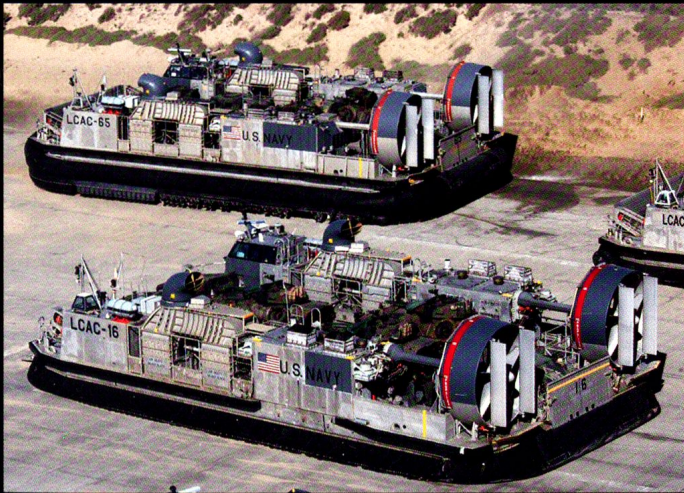
Le LCAC, entré en service en 1986, peut emporter jusqu'à 60 tonnes de charge (75 tonnes en surcharge) à plus de 40 noeuds.