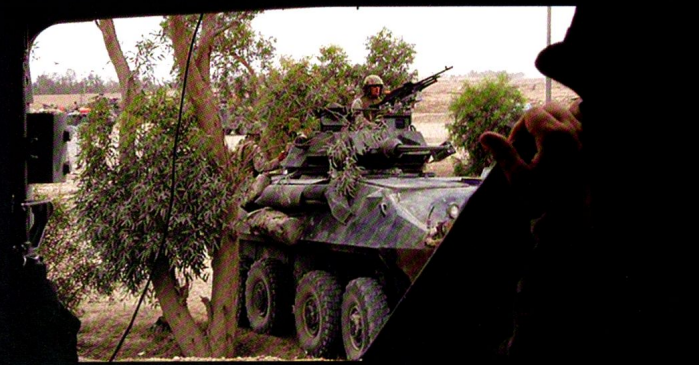
Véhicules d'exploration LAV Piranha à Fallujah, Irak.