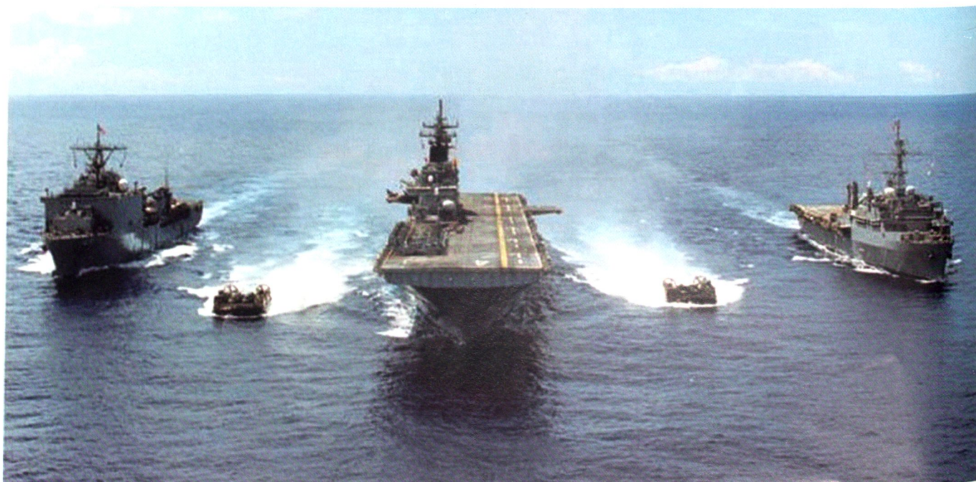
Un Expeditionary Strike Group peut emporter jusqu'à 2'200 Marines.