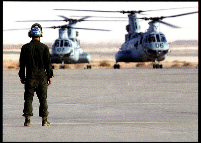
Les hélicoptères CH-53 et CH-46 (photo) servent au transport de charges et de troupes sur le rivage.