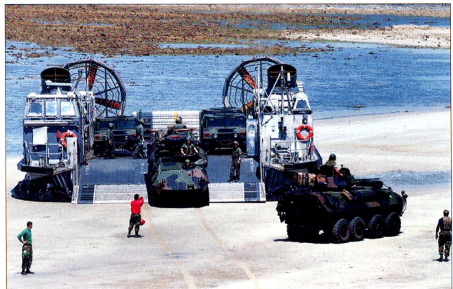
Les transports rapides peuvent s'effectuer avec les LCAC. Chacun peut transporter plus de 60 tonnes de charges.