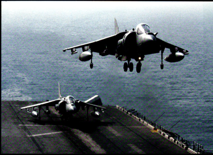
Chaque navire de débarquement (LHA/LHD) peut emporter six AV-8B Harrier II . Ceux-ci sont aptes à mener des actions air-air ou air-sol, de jour comme de nuit.