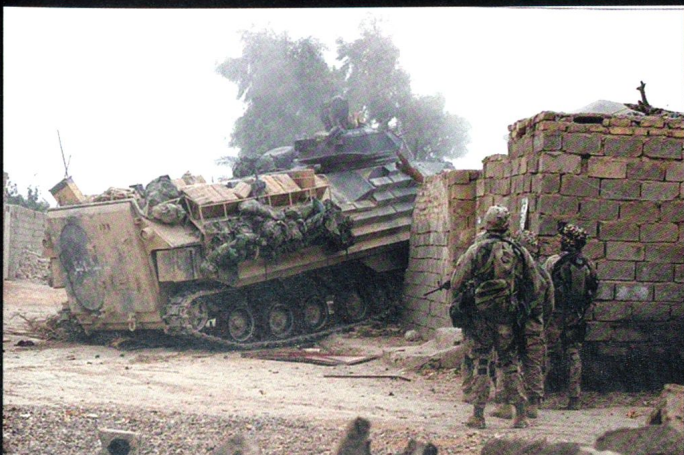
Marines lors des combats de localité de Fallujah.