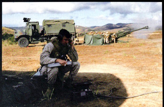
L'obusier de 155 mm M198 peut être tracté ou héliporté.