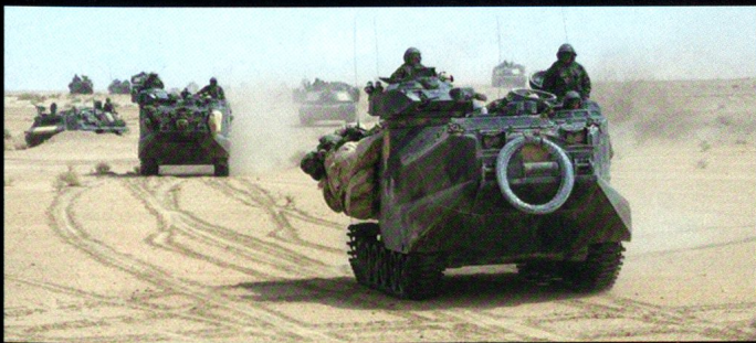
AAV-7 et M1 Abrams du Corps des Marines, en Irak.