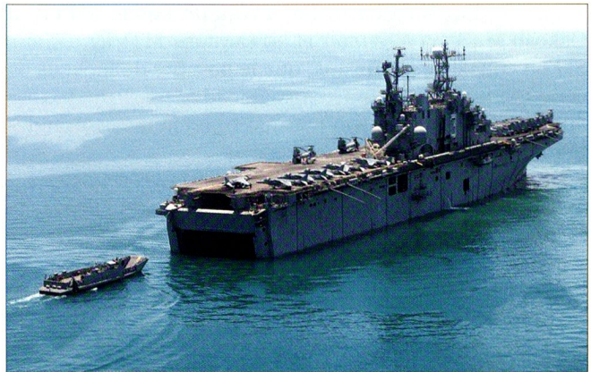
L'USS Belleau Wood (LHA-3), photographié le 7 juillet 2004.

Un MEU dispose de 4 chars de combat M1A1 Abrams, 7 à 16 LAV-25 ( Piranha II ), 15 AAV-7 Amtracks de débarquement, 6 obusiers de 155 mm M198 ou M777, 8 mortiers de 81 mm, 8 efa BGM-71 TOW, 8 FGM-148 Javelin, 4 à 6 AH-1W Super Cobra , 3 UH-1N Twin Huey , 12 Ch-46 E Sea Knight , 4 CH-53 E Sea Stallion , 6 AV-8 B Harrier II , 4 tracteurs, 2 élévateurs à fourche tous terrains