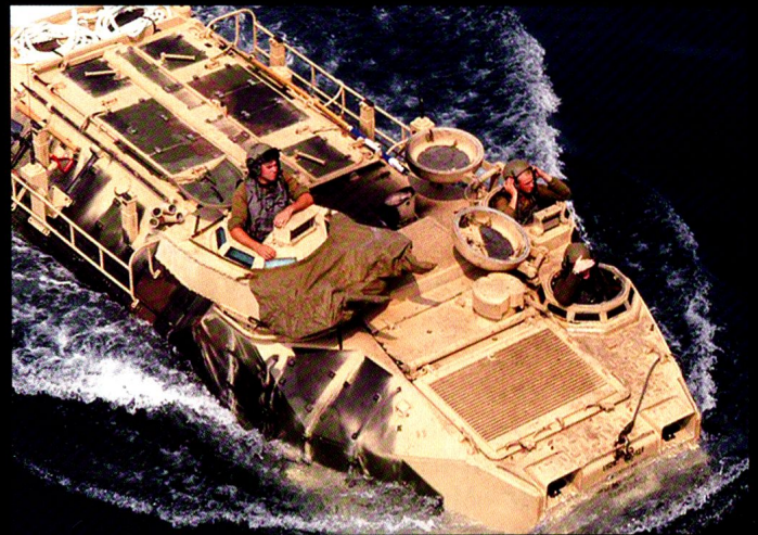
L'AAV-7 pèse 29,1 tonnes et peut emporter 3+25 Marines. Malgré son surblindage, il accuse son âge.