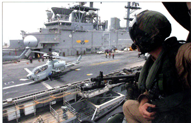
Les LHD/LHA emportent des hélicoptères de combat et des avions pour l'appui aérien rapproché des formations de combat au sol (MEU). Ici, un Sea Cobra équipé de missiles antichars Hellfire .