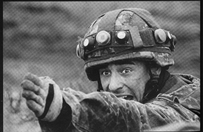
Grenadier de chars du Panzerbataillon 33 à Münster.