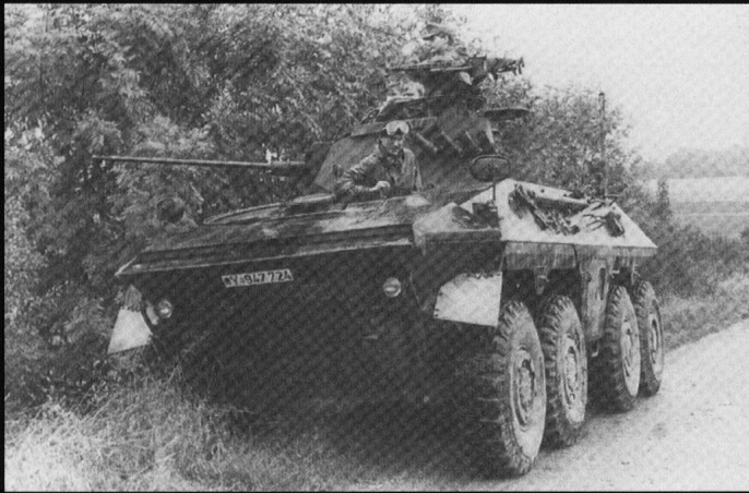
Le véhicule de reconnaissance Luchs , développé dans les années 1960 .