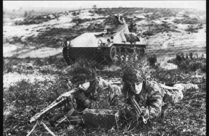
Les Panzergrenadiere d'après-Guerre ont disposé de véhicules transport de troupes HS-11 et HS-35.