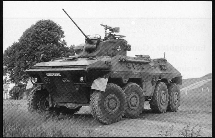
Le Luchs est armé d'un canon de 20 mm.