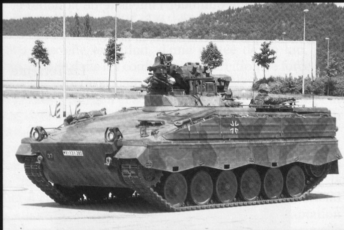
Le véhicule de combat d'infanterie Marder a été un modèle pour le développement des VCI de l'OTAN dans les années 1970-1980.