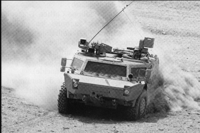
Le Fenek est moins lourdement armé, mais dispose de capteurs performants.