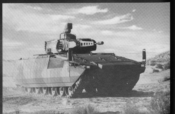
Le VCI du futur: le Puma .