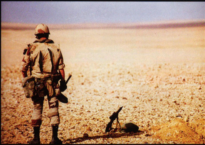
Illustrations de cette page : 2 e REI.