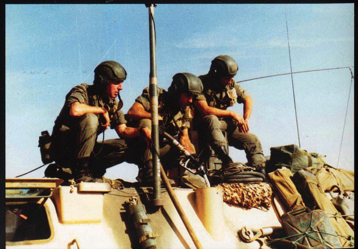
L'équipage d'un VAB ravitaille.