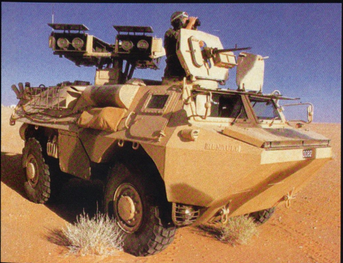
Le Mephisto est un VAB porteur de 4 lance-missiles HOT .