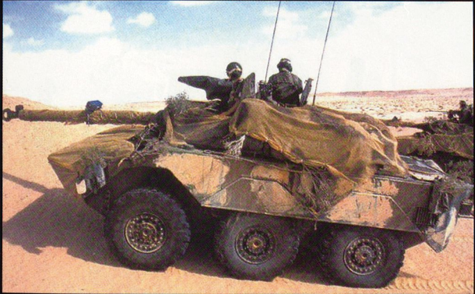
L'AMX 10RC comporte de nombreuses pièces interchangeables avec le véhicule de combat d'infanterie AMX 10P, qui est chenillé et emporte un canon de 20 mm.