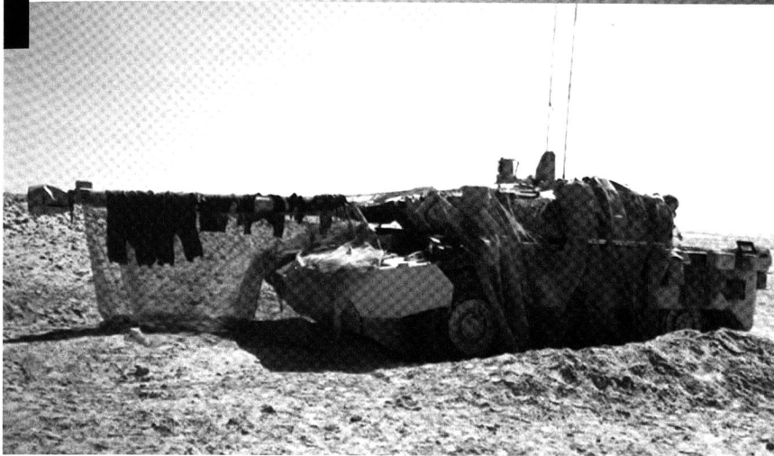
300 chars légers AMX10RC ont servi dans l'armée française. L'engin pèse 17 tonnes et est armé d'un canon de 10,5 cm L48. Il roule à 85 km/h et peut parcourir 800 km.