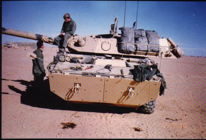
L'AMX 10RC pèse 15 tonnes et est armé d'un canon de 10.5 cm L48 (Vo 800m/s), armé de 38 coups.