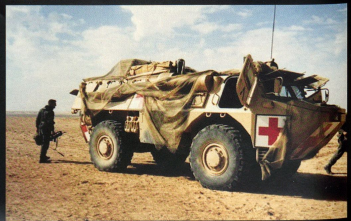
Le VAB pèse 13.8 tonnes et se décline en de nombreuses versions : ici une ambulance.