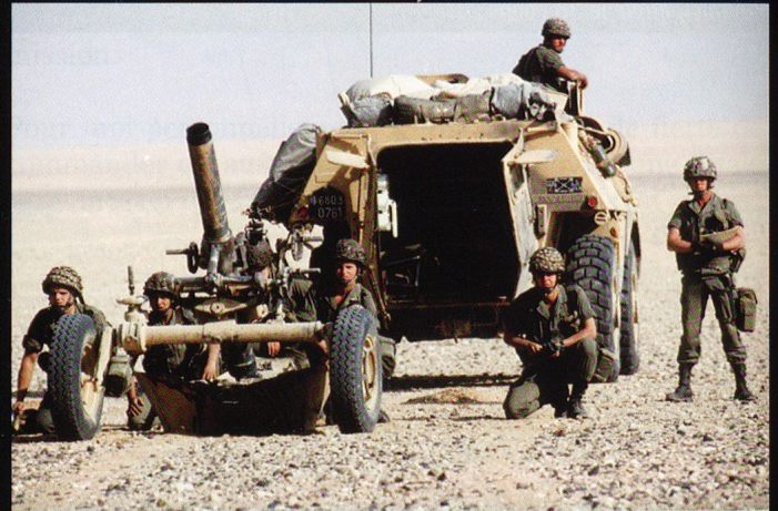
Entraînement des mortiers de 12 cm devant la presse.