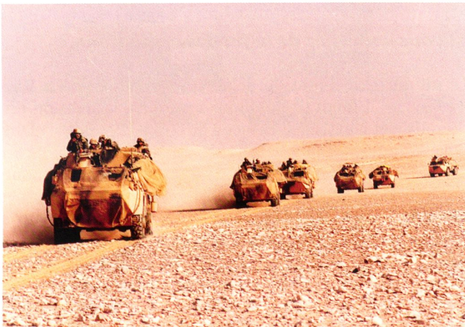
La 2 e compagnie du 2 e REI à l'assaut d'As-Salman.