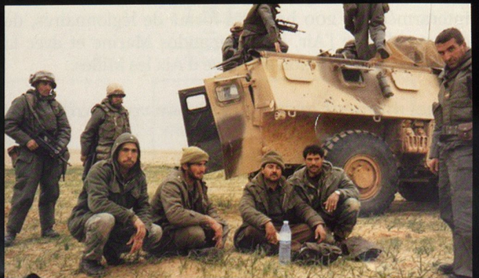
Les combats du 3 e RIMa dans l'objectif d'attaque, As-Salman.