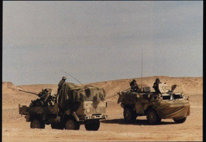
Un TRM2000 armé d'un canon DCA de 20 mm et un Mephisto couvrent le régiment.