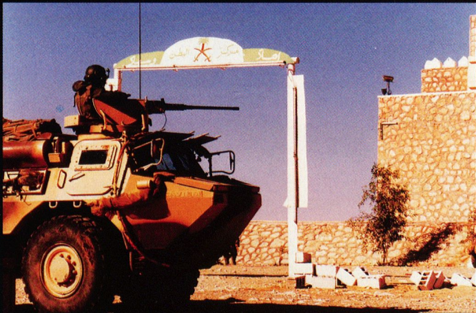
Un poste d'observation est installé avant l'engagement d'une patrouille de reconnaissance. Les VAB des chefs de pelotons sont armés d'une mitrailleuse de 12,7 mm.