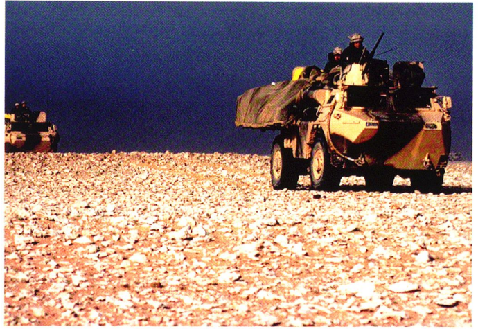
Le régiment attaque et se rapproche de l'aérodrome d'As-Salman.

Oui, peut-être aussi parce qu'on a fait très attention de les accueillir, de les encadrer, de les briefer, de faire qu'ils repartent toujours avec quelque chose à raconter.