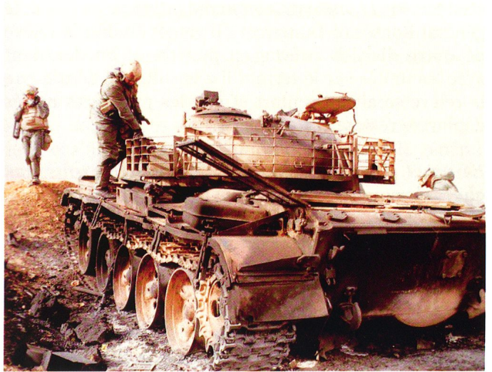
Char T-55 irakien détruit sur l'objectif d'attaque.