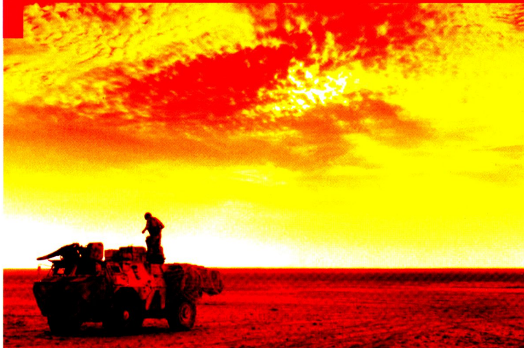
Couleurs magnifiques du crépuscule dans le désert.