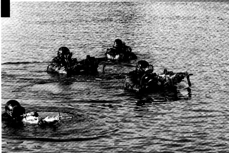
Un commando marine français lors de la journée de la présentation de la Marine nationale en 2008