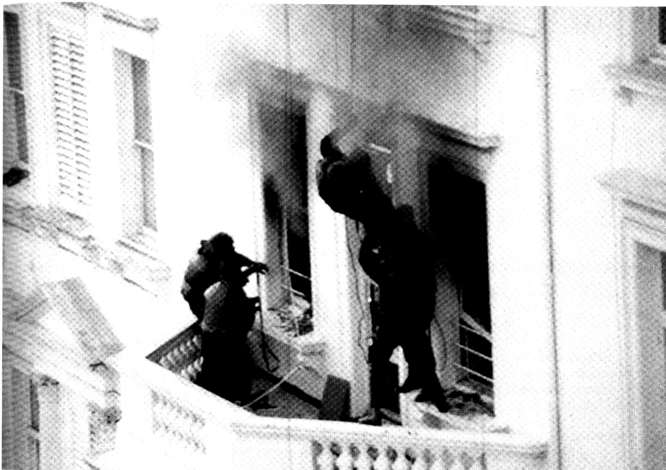
La libération de l'ambassade d'Iran, place St James à Londres en 1980 par le SAS, l'une des opérations les plus connues.