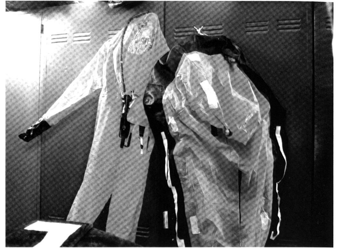
Tenue imperméable et auto-gonflable pour la sortie d'urgence des sous-marinières. N.B. Contrairement à cette tenue standard pour les sous-marinières, celle en dotation aux hommes du SPAG a été créée exprès et sur mesure par la société 100% italienne DiveSystem.