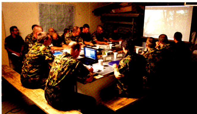
Les informations issues de l'exploration sont transmises au moyen de bulletins de renseignement, mais forment une partie essentielle des rapports de bataillon.