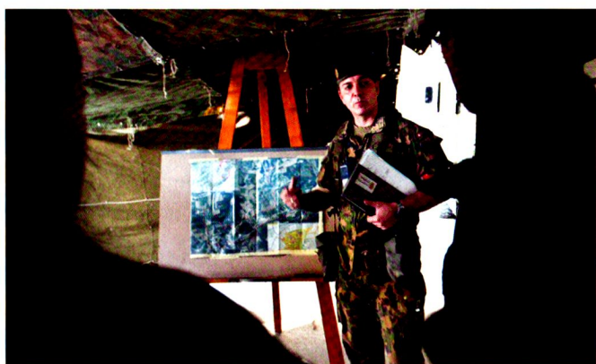
Du PC mobile à l'EAVC, l'information doit suivre, au plus vite.