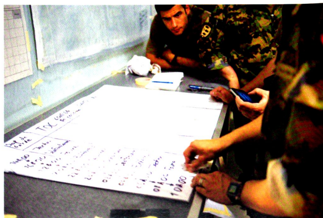
Au PC mobile, la relève et la garde sont assurées en permanence.