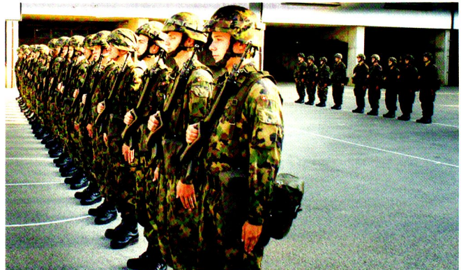
Présentation formelle de la compagnie logistique, au départ de son exercice de 48 heures, ZOUBIDA, le 24 août 2011.

Le lendemain, la cp log a reçu la mission d'effectuer un ravitaillement tactique d'une compagnie de chars