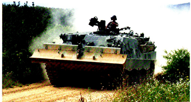
L'équipage du char de dépannage Büffel a vu du pays durant le CR 2011...