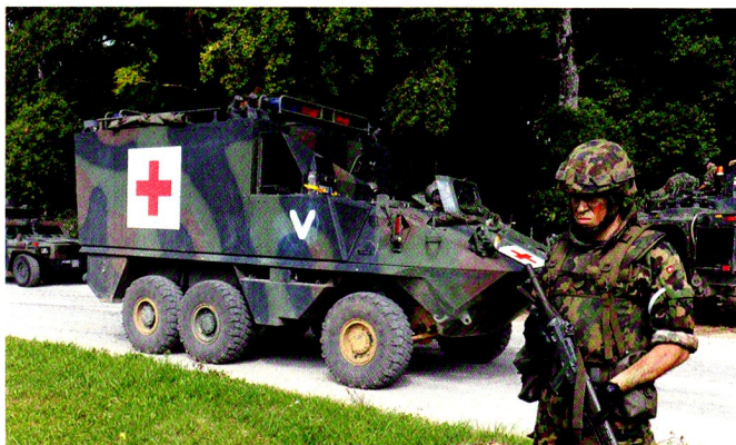
L'ambulance blindée San Piranha a été de piquet 24/7 et a été engagée dans de nombreux exercices de compagnie.