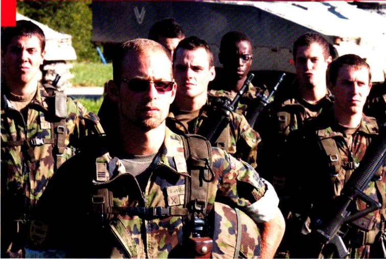
Cp log chars 17