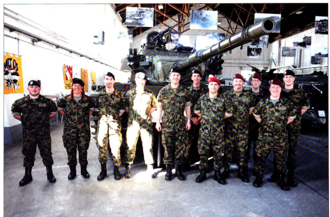
L'état-major du bataillon de chars 17 à l'issue des JTEM et du cours d'introduction Leo WE , au musée des chars de Thoun, devant le char 55 Centurion .