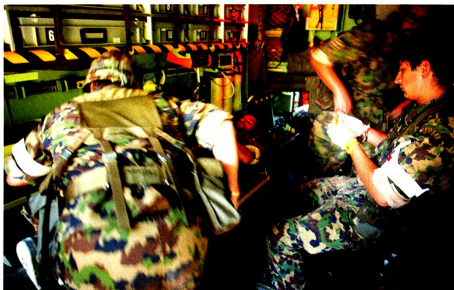
Les exercices d'engagement sanitaires ont eu lieu, pour la plupart, durant les pauses de combat entre les exercices, afin de ne pas diminuer l'intensité de l'instruction.