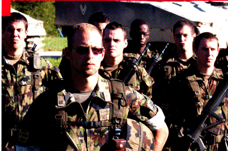
Cp log chars 17