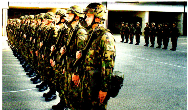
Présentation formelle de la compagnie logistique, au départ de son exercice de 48 heures, ZOUBIDA, le 24 août 2011.

Le lendemain, la cp log a reçu la mission d'effectuer un ravitaillement tactique d'une compagnie de chars