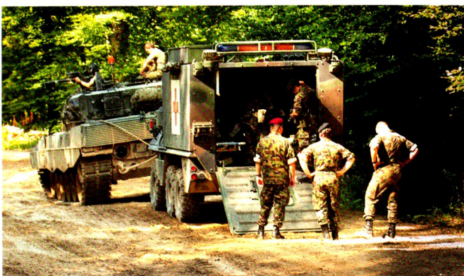
La direction d'exercice -épaulée par une équipe photo- suit le déroulement des engagements sanitaires, afin de documenter son évaluation.

à un point fixe. Les mesures d'urgence concernant cet engagement (préparation du matériel et des véhicules) ont été prises immédiatement. Un détachement avancé a reconnu l'emplacement du ravitaillement. Par la suite, le détachement avancé et la citerne de ravitaillement montée sur un véhicule (BBC) ont pris un secteur d'attente. Après avoir reçu la confirmation des coordonnées du point de contact, la BBC a été déployée avec succès. Le dispositif mis en place a permis d'orienter puis de ravitailler 11 chars Léo WE et 2 CV90 dans un bref délai. La BBC permet en effet, en engageant deux spécialistes carburant, d'effectuer le ravitaillement de 4 chars simultanément. Le dispositif a ensuite été préparé au départ en quelques minutes. La troupe est rentrée un peu plus de 3 heures après avoir reçu cette mission. Ce ravitaillement tactique a permis à certains de découvrir les possibilités logistiques actuelles, a été pour les autres un rafraîchissement bienvenu et pour tous, un exercice apprécié et couronné de succès. Notons en outre que cette mission a été reçue durant la période durant laquelle la sct rav/évac devait assurer l'organisation et le ravitaillement en subsistance. Les cadres ont donc dû engager toutes leurs réserves.