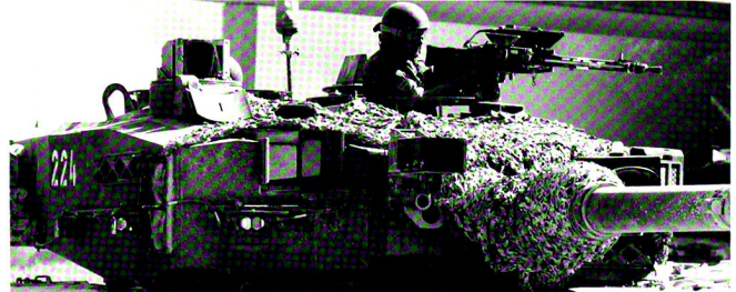
Le passage en force à Combe-la-Casse a été «drillé» avec succès.

Pour conclure, il me semble important de souligner encore une fois la qualité et l'intensité des exercices que nous avons vécus. Tout a été entrepris afin d'optimiser le nombre de déroulements, en gardant toujours à l'esprit une volonté d'économiser le carburant.