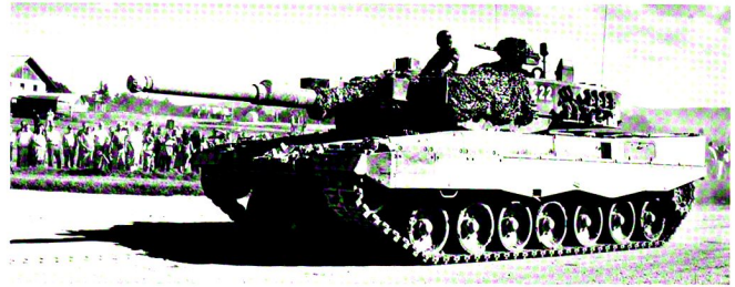
ZITADELLE : Défilé devant le commandant de brigade, à Nalé.

De plus, il est essentiel d'assurer un appui de feu indirect à la compagnie qui débouche d'un passage obligé, afin de forcer l'adversaire à abandonner ses positions préparées, ou au pire à rester à couvert.