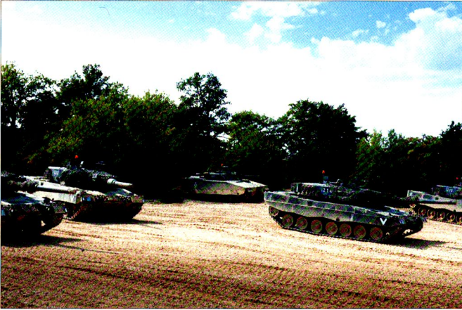
Une section de chars de la 17/2 a été engagée pour permettre à la 17/3 de former une véritable compagnie d'avant-garde.