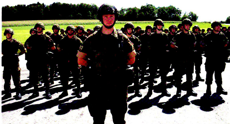
Cp chars 17/2