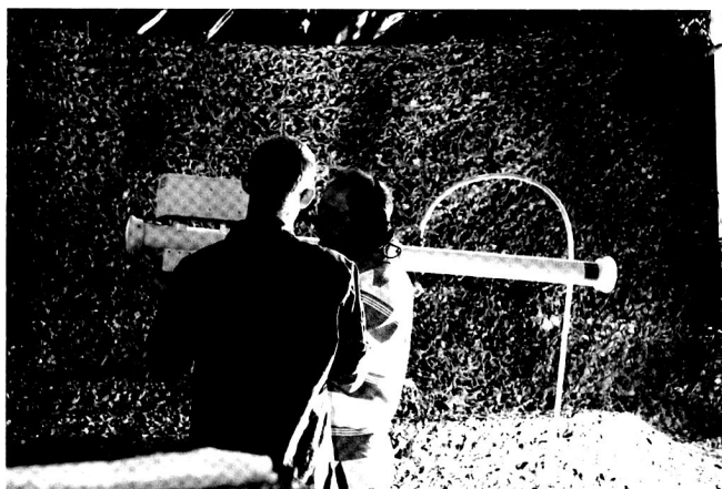
A Dübendorf, les spectateurs ont pu essayer nos simulateurs de tir mobiles.

Vers 1800, la fête s'est terminée par un concert du Swiss Army Big Band, donnant une ultime touche musicale sur cette belle journée qui a consacré les 75 ans de la DCA.