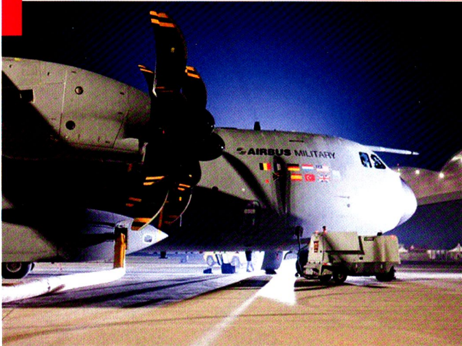
L'avion de transport militaire européen lors de son premier vol.