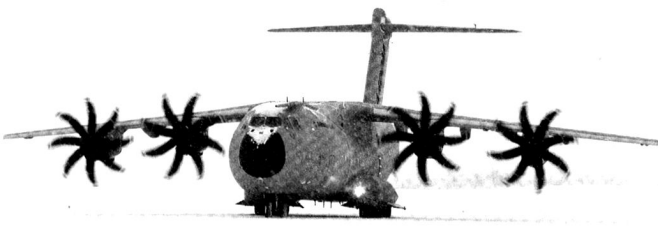
Le Grizzly porte bien son nom, sur cette photo prise le 8 février 2011 en Suède, lors des tests en très basse température.