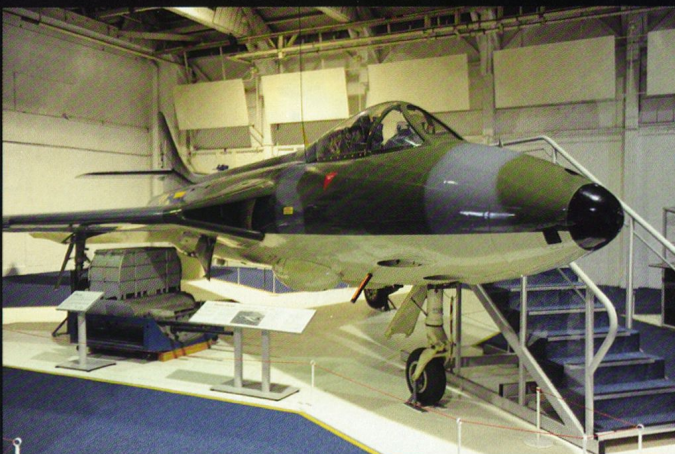
Le Hunter (ici un des derniers modèles : FGA9) a connu une brève carrière au sein de la RAF. Mais il a impressionné les foules, par ses démonstrations acrobatiques (Black Arrows – Sqn 11).