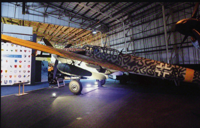
Le concept de « chasseur lourd » Bf 109 n'a pas été un grand succès. Mais l'appareil a pu se reconverter dans la chasse nocturne.