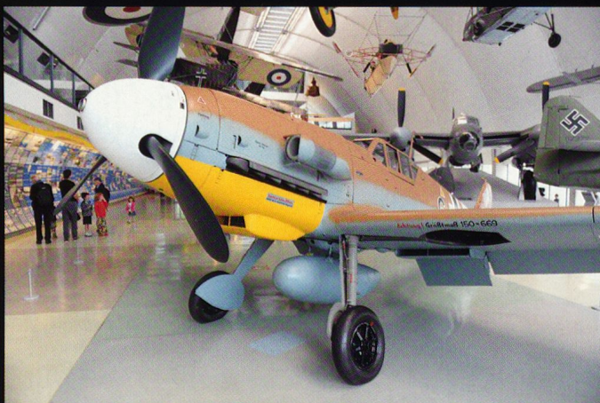
Le Messerschmitt Bf 109 F, introduit en 1941 en Afrique du Nord, a causé de nombreux soucis à la RAF en Méditerranée.