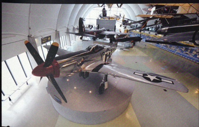
Un P-51 Mustang , armé de 6 mitrailleuses de 12,7 mm.