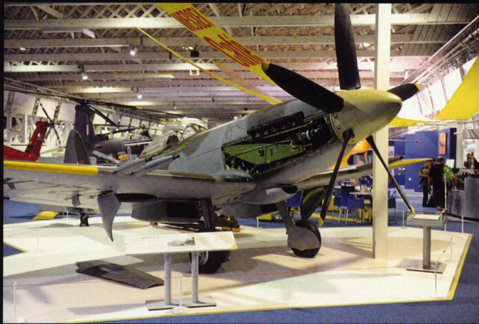
Le Spitfire F24 est un des derniers chasseurs à piston ; son moteur fournit 1'478 PS et il vole à 594 km/h. Il est armé de 4 canons Hispano Suiza de 20 mm.