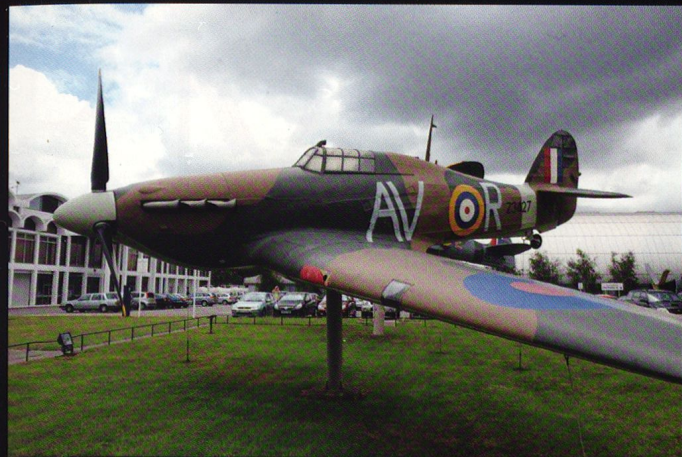
Le Hurricane , cheville ouvrière du Fighter Command durant la bataille d'Angleterre de 1940. Celui-ci porte le code (AV) du 121 «Eagle» Squadron de la RAF.