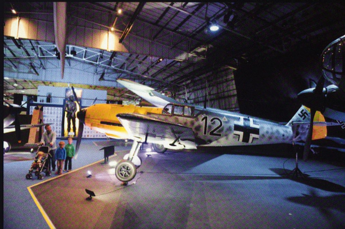
Un Messerschmitt Bf-109 E aux couleurs de la Luftwaffe durant la bataille d'Angleterre. Il emporte un canon de 20 mm et deux mitrailleuses de 7,9 mm.