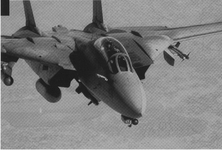
Le F-14D a terminé sa carrière en tant que « camion à bombes » au dessus de l'Afghanistan.