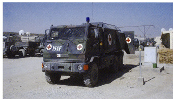
473 Eagle IV ont été commandés par la Bundeswehr, ainsi que 31 ambulances Yak sur châssis Duro III . Ci-contre, les nouveaux venus : Panzerhaubitze et Boxer .