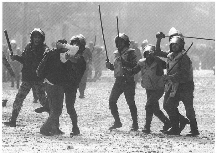
Démonstrations et engagement de forces égyptiennes à proximité de la place Tahir, au Caire.