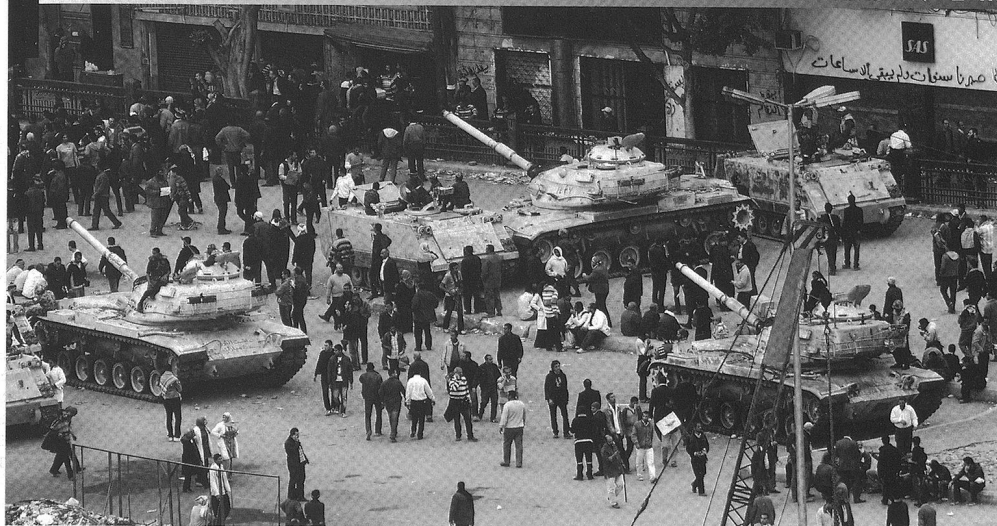
Blindés de l'armée égyptienne au Caire, lors des émeutes qui ont fait tomber le président Mubarak.