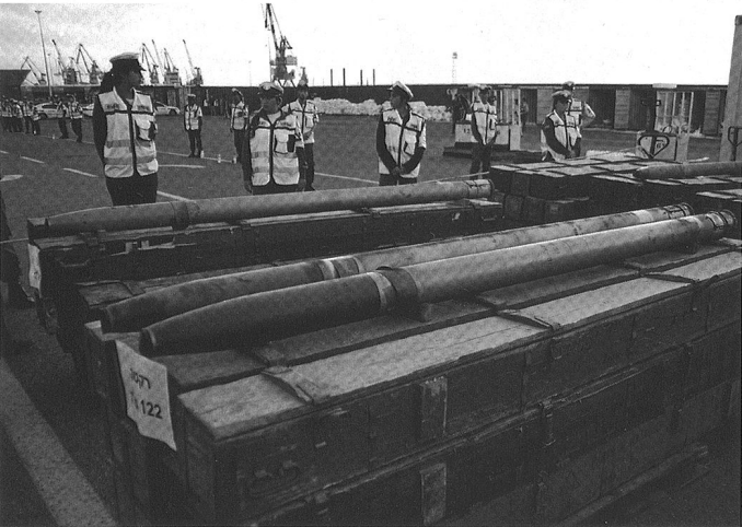
Les dangers n'ont pas disparus. Mais ils se sont transformés... et peut-être déplacés.