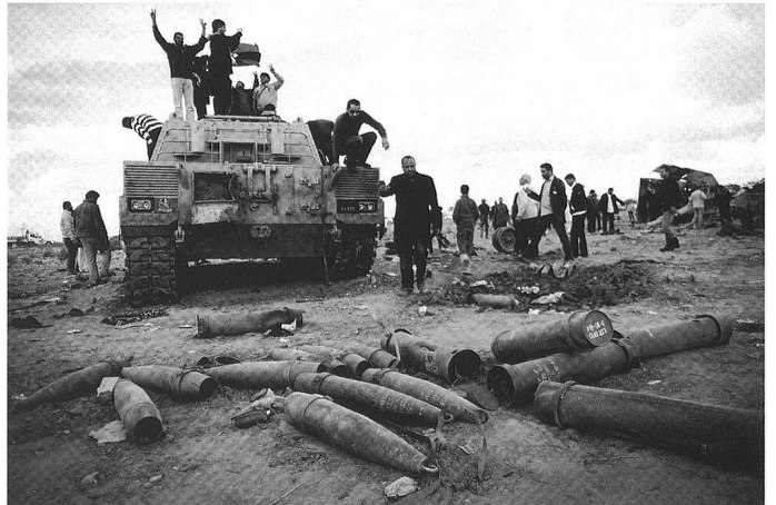
Le conflit lybien a créé de nouveaux précédents internationaux. Ses conséquences ne sont pas maîtrisées.

La rupture de la zone méditerranéenne qui se profile aujourd'hui à l'horizon, laisse-t-elle entrevoir un nouveau départ pour l'Europe ? A première vue, on serait tenté de dire non : la crise de la monnaie unique et les difficultés qui en découlent pour les grands États (France, Royaume-Uni, Italie, Espagne), le risque de désindustrialisation de l'Europe que comporte cette crise ne devraient pas s'améliorer avec l'écroulement de la façade sud de la Méditerranée... au contraire ! L'afflux de réfugiés, l'économie grise et les trafics de tous ordres qui se mettront inmanquablement en place devraient représenter un défi et une charge supplémentaires pour les États européens déjà gravement affaiblis. Dès lors, l'affaissement du sud de l'espace méditerranéen devrait surtout accentuer celui de l'Europe occidentale... dans un premier temps en tout cas ! Mais ensuite... ?