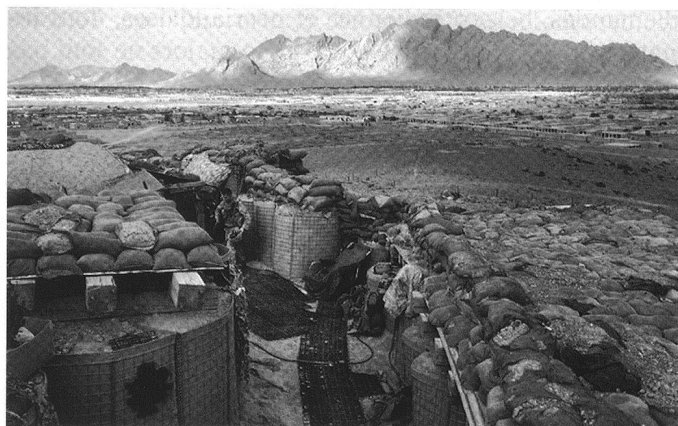
Position fortifiée britannique en Afghanistan. Page suivante : tir d'un missile Javelin .

La suppression de l'Union de l'Europe occidentale en 2000 a entraîné un effet pervers. L'article 5 de ses statuts spécifiait l'automatisme de l'engagement militaire en cas d'agression d'un Etat-membre, alors que l'article V du traité de Washington de 1949 instituant l'OTAN laisse à chaque Etat le choix de la riposte. Ainsi les Etats d'où proviennent les contingents doivent-ils, dans la plupart des cas, accepter de les mettre à disposition d'états-majors européens ou de l'OTAN.