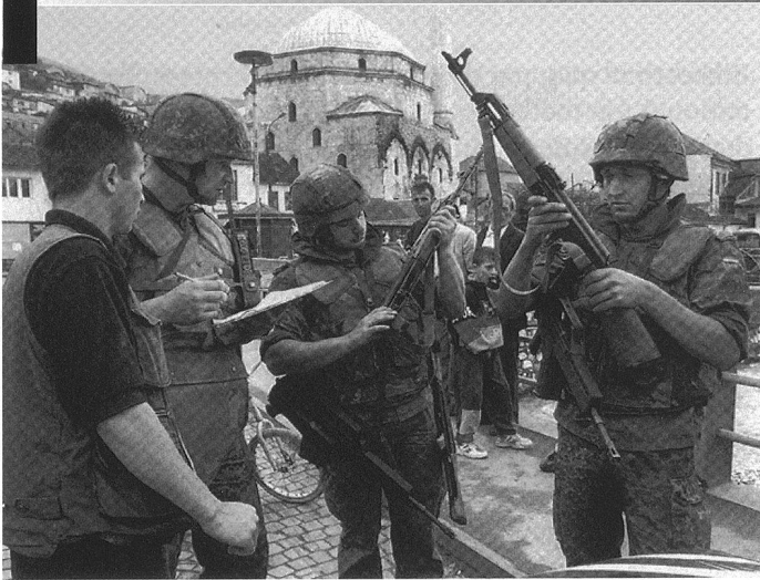
Kosovo: Des soldats de la Bundeswehr réceptionnent et confisquent des armes d'assaut.