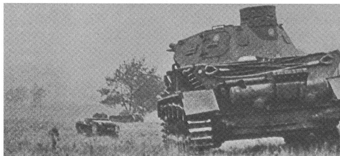
Un PzKpfw IV pousse derrière un écran de PzKpfw I.

Les 6. et 8. Pz.Div. comptent comme les premières un seul régiment d'infanterie à trois bataillons, en plus d'un bataillon de motocyclistes. Les 7. et 9. Pz.Div. possèdent elles aussi un bataillon de motocycliste, mais deux régiments à deux bataillons d'infanterie. Enfin, au sein de la 9. Pz.Div., le Kradschützen Bataillon 59 et l'Aufklärungsabteilung 9 sont par ailleurs regroupés en un régiment d'exploration – le 9. A noter que les Pz.Div. 6-9 ne comptent qu'un seul régiment de chars à trois bataillons.