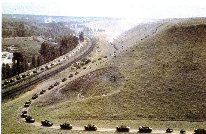
La 7. Pz.Div. de Rommel progresse à travers la «trouée» de Sedan.