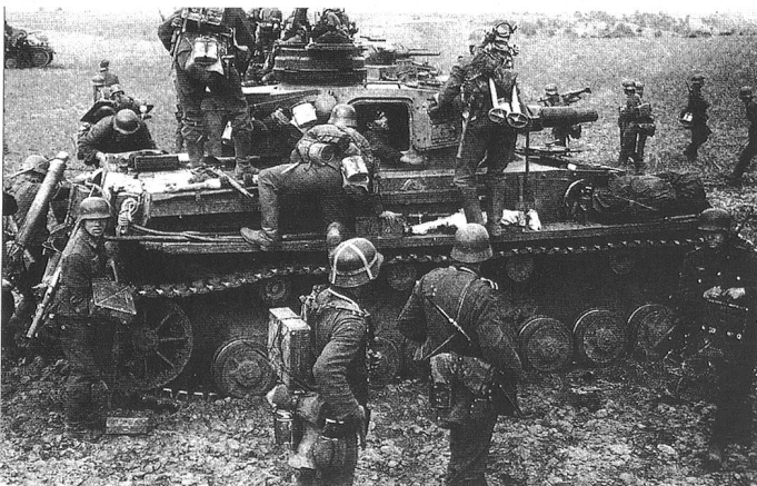
Le PzKpfw IV montre ici son rôle initial d'appui à l'infanterie, grâce à son canon court de 7,5 cm L24. On le voit ici « charger » un groupe de mortiers. Un groupe mitrailleur est en train de prendre place sur l'engin suivant.