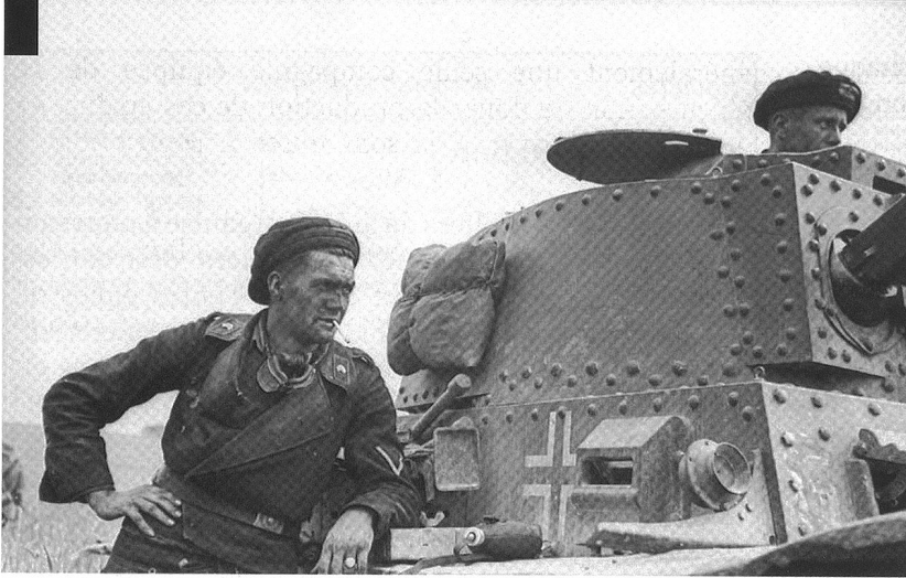
Les équipages de chars sont reconnaissables à leur uniforme noir. Ici, un équipage de PzKpfw 38 (t) du Pz. Rgt. 25 (7. Pz.Div.) en France, juin 1940.