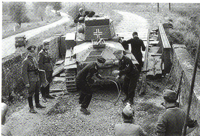
Le général Rommel vient assister au franchissement d'un PzKpfw 38 (t) de la 6 e compagnie du Pz.Rgt. 25.

qui auraient retournés son dispositif. La panique s'étend à l'artillerie divisionnaire. Le 14 mai, le commandement français prend peur et tente par tous les moyens -envoyant notamment tous ses bombardiers disponibles- de détruire les ponts sur la Meuse. Sans escorte, 44% des bombardiers sont abattus et les tentatives sont infructueuses. 11