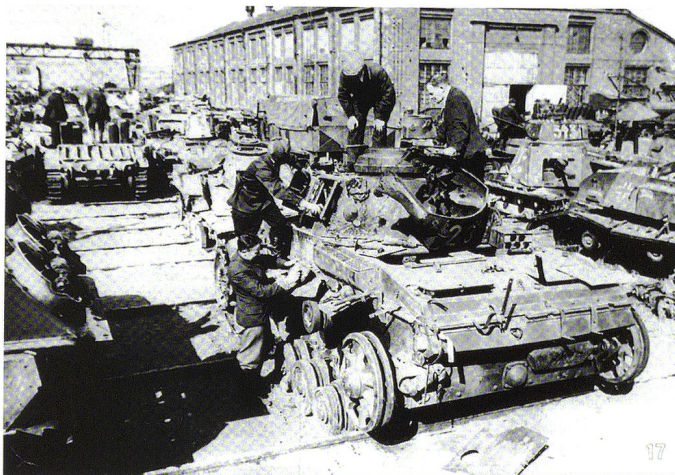
Un atelier de réparation rassemble de nombreuses épaves - un PzKpfw III au centre, à droite un Pz.Jg.I et un Sturmgeschütz III, à gauche plusieurs chars d'infanterie britanniques Matilda .