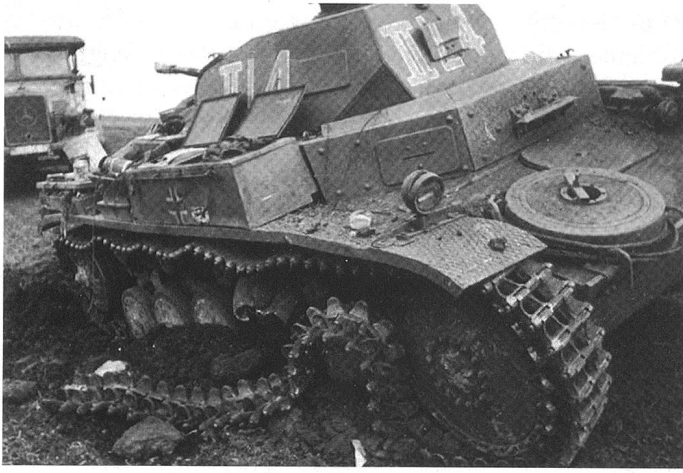
Le PzKpfw II équipe toujours en grand nombre les formations blindées de la Wehrmacht en 1940. Il est engagé dans des tâches d'appui et contre des objectifs « mous » ou débarqués; ou rend de précieux services comme engin d'exploration.