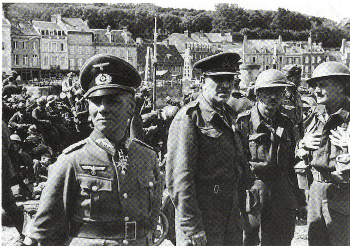
Deux illustrations montrant Rommel en France, à proximité de son véhicule de commandement (Sd.Kfz. 250/3) et à Cherbourg, respectivement.

de la 6 e Armée française, assemblés à quelques kilomètres de Sedan, sont mis en déroute et la 9 e armée, vulnérable sur son flanc, se rend en masse. Le même jour, la 102 e division de forteresse encerclée se rend à Monthermé, face aux 6. et 8. Pz.Div. La 2 e Armée française est en déroute, la 9 e n'a pas le temps de fortifier ses positions avant d'être percée par la 7. Pz.Div. de Rommel.