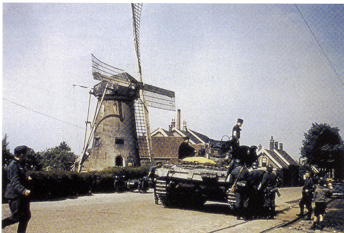
Un PzKpfw III progresse en Hollande.