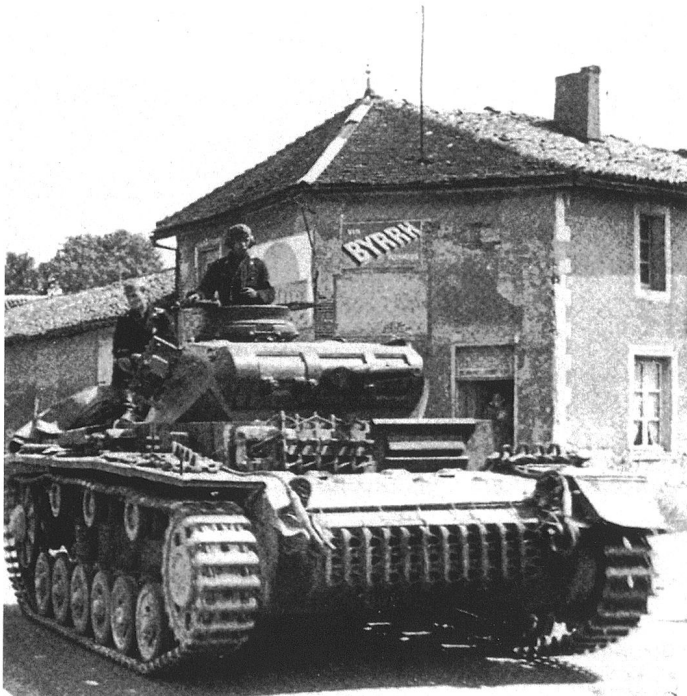
Le PzKpfw III subit d'importantes améliorations à partir de 1940. L'engin est pour le moment encore armé de deux MG34 coaxiales, à droite du canon, en plus d'une arme dans la caisse, servie par l'opérateur radio. Il est armé d'un canon de 3,7 cm L 46,5 à vocation antichar.