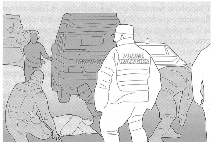
La collaboration de l'infanterie avec les spécialistes.

Le bataillon d'infanterie est mentalement prêt en tout temps à inclure non seulement des spécialistes militaires, mais aussi à intégrer des moyens avec une plus grande puissance de feu et une plus longue portée comme l'artillerie, les formations de grenadiers de chars et les formations de chars, ou à collaborer avec les moyens civils du réseau national de sécurité.