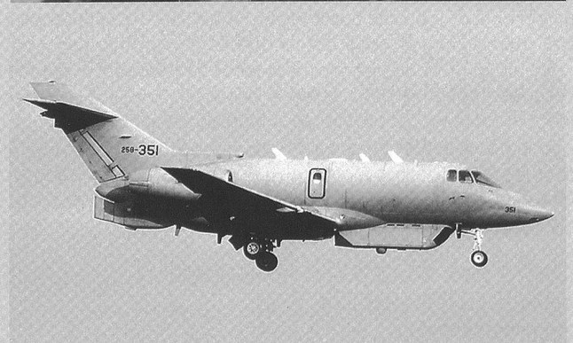
En haut : Boeing E-737.