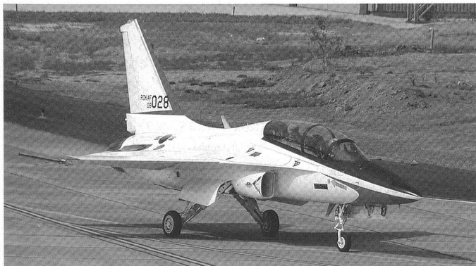
Le T-50 est un avion d'entraînement et d'attaque développé par Korean Aircraft Industries (KAI).