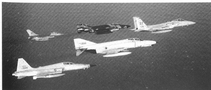
La ROKAF alligne encore sur le papier 68 F-4E Phantom II et 170 F/KF-5E/F essentiellement utilisés pour l'entraînement.