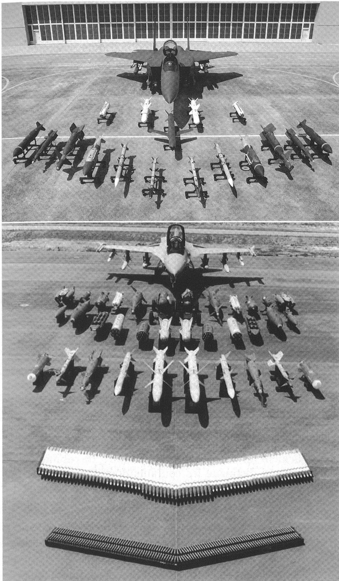
Ci-dessus : F-15K et F-16 avec leur panoplie d'armements.