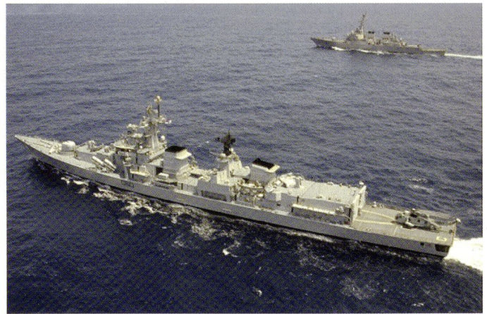
Le destroyer indien INS Mysore (D-60) et le destroyer américain USS Fitzgerald (DDG-62) lors de l'exercice MALABAR 2007.