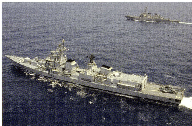
Le destroyer indien INS Mysore (D-60) et le destroyer américain USS Fitzgerald (DDG-62) lors de l'exercice MALABAR 2007.