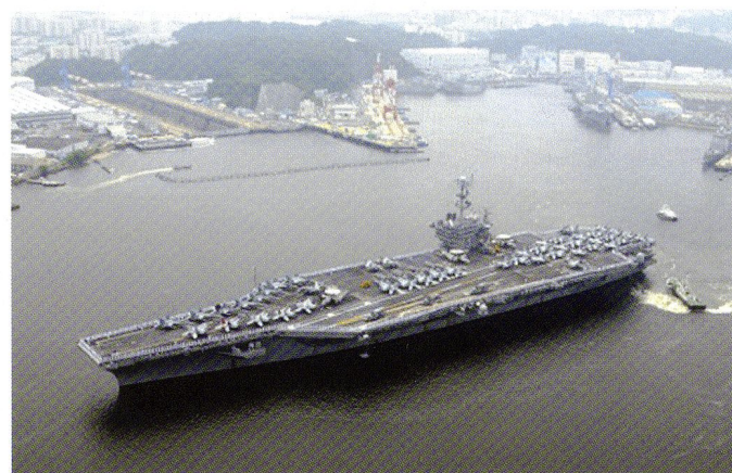
Le porte-avions USS George Washington (CVN-73) dans le port de Yokosuka.