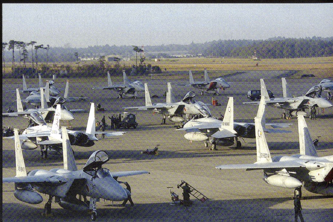
Le Japon est un des principaux utilisateurs du F-15, avec 180 exemplaires en dotation. On sait par ailleurs que le Japon a fait part de son intérêt pour le F-22 et a officiellement commandé 42 F-35.