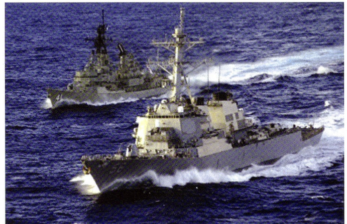
Le destroyer américain USS John S. McCain (DDG-56) en compagnie du destroyer australien HMAS Brisbane (DDG 41) de la classe Charles F. Adams .