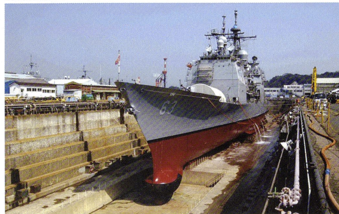
Le croiseur USS Cowpens (CG-63) en cale sèche à Yokosuka.