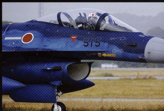
Mitsubishi a laborieusement développé une version locale du F-16, baptisée F-2. Au total, 49 monoplaces et 33 biplaces ont été construits.