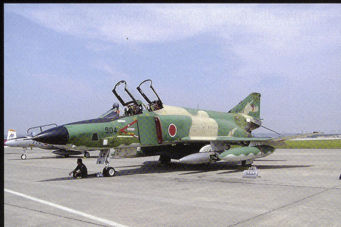
...et 26 RF-4E/EJ Phantom II de reconnaissance non armés.