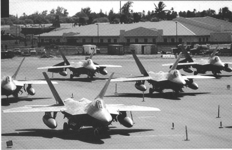
Le F-22 Raptor est l'appareil le plus moderne de l'US Air Force, ici basés à Hickam AFB, Hawaii, 12.02.2007. Ils sont en route pour leur déploiement opérationnel à Kadena, au Japon. Ces appareils appartiennent au 19 th Fighter Squadron. Le déploiement de cet appareil en Alaska et dans le Pacifique montre clairement qu'il est destiné à opérer davantage au-dessus du Pacifique que de l'Atlantique.