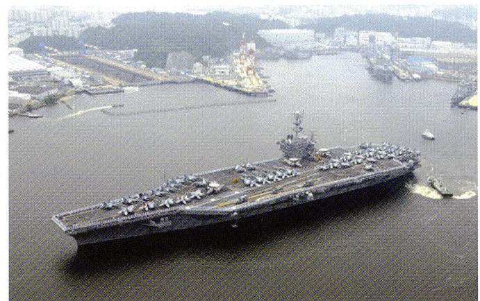
Le porte-avions USS George Washington (CVN-73) dans le port de Yokosuka.