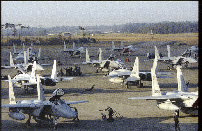
Le Japon est un des principaux utilisateurs du F-15, avec 180 exemplaires en dotation. On sait par ailleurs que le Japon a fait part de son intérêt pour le F-22 et a officiellement commandé 42 F-35.