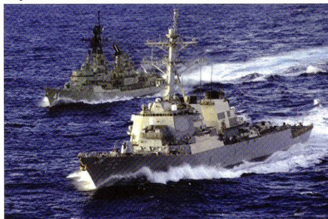
Le destroyer américain USS John S. McCain (DDG-56) en compagnie du destroyer australien HMAS Brisbane (DDG 41) de la classe Charles F. Adams .