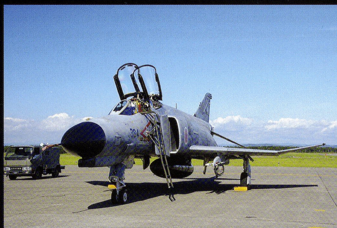
Les Forces d'autodéfense japonaises emploient encore 91 F-4EJ surnommés «Kai»...