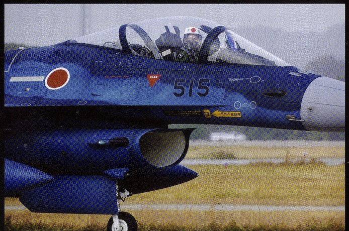
Mitsubishi a laborieusement développé une version locale du F-16, baptisée F-2. Au total, 49 monoplaces et 33 biplaces ont été construits.