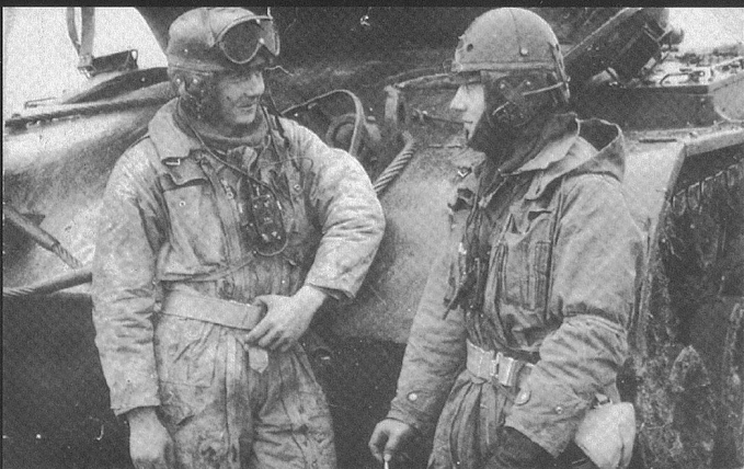
Equipage d'un M-47 à la pause cigarette.