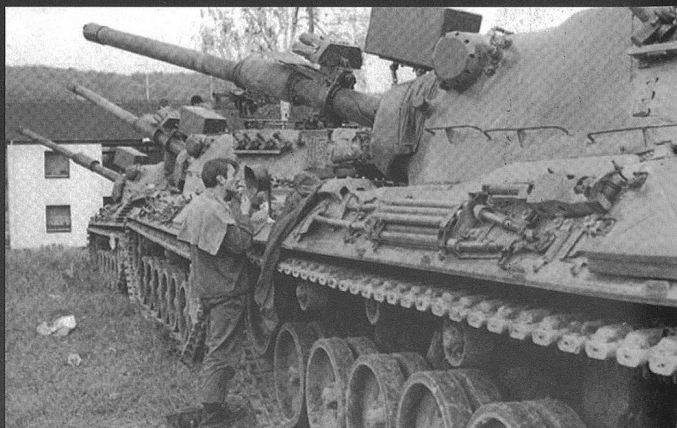
Scène de la vie quotidienne, à côté du Léopard 1 .