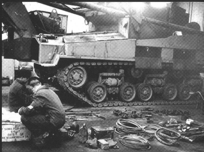
Le M-74 est un véritable atelier sur chenilles.