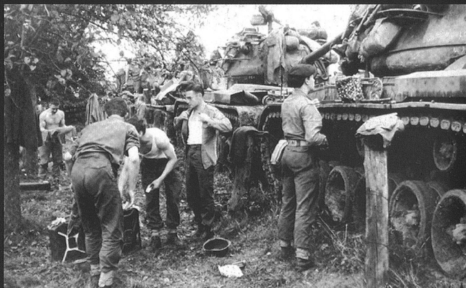
Toilette du matin, à proximité des M-47.