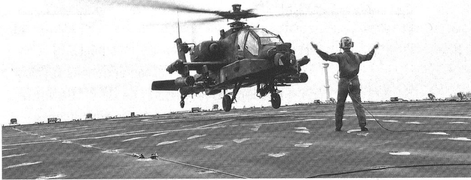
La Belgique et la Hollande peuvent disposer d'atouts réciproques, à l'instar des 29 AH-64D Apache néerlandais.