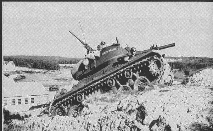
Char léger M24 «Houffalize» dans ses oeuvres.