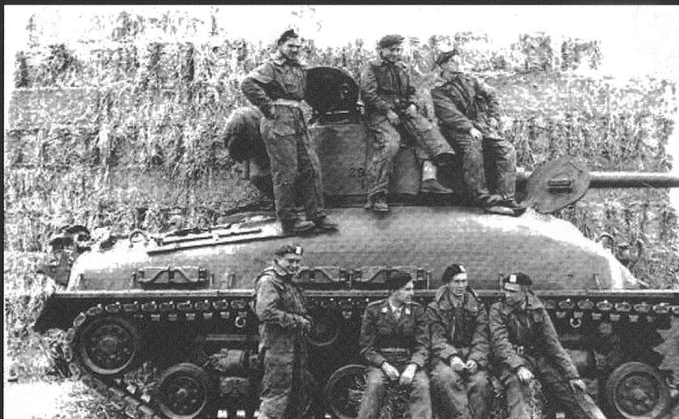
La Belgique a longtemps servi des M4 (ici armé d'un obusier de 10,5 cm) des surplus américains.