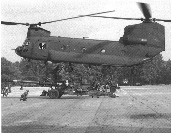
Les Pays-Bas disposent encore de 17 CH-47 D/F Chinook (photo) et de 8 Cougar.