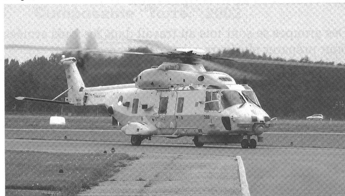
Les deux pays mettront conjointement en oeuvre le NH-90 Merlin produit par le consortium Agusta-Westland.

l'hélicoptère européen fabriqué par Eurocopter (13 aux Pays-Bas, 8 en Belgique). L'objectif est d'avoir un stock coordonné des pièces détachées et non plus deux stocks. Il ne serait pas ainsi nécessaire pour les deux armées de disposer de pièces en double.