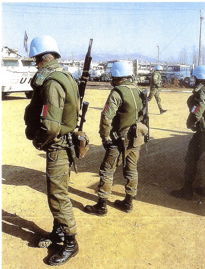
Ci-dessus, casques bleus français à proximité de Sarajevo.