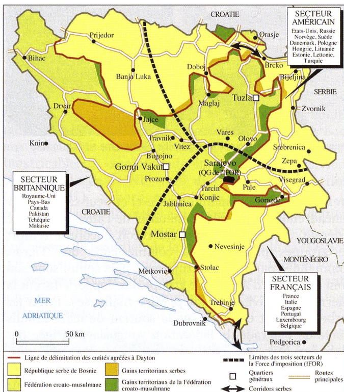
La Bosnie après les accords de Dayton

conseil de défense croate (HVO) est créé. Celui-ci reçoit également un soutien de l'extérieur, en la personne de la Croatie de Franjo Tudjman nouvellement indépendante. Néanmoins ce soutien n'est pas aussi conséquent que celui apporté par la Yougoslavie à l'entité serbe de Bosnie, puisque la Croatie doit d'abord elle-même équiper et former son armée. Il en résulte que les Croates de Bosnie sont la puissance médiane de la région, reconnaissant l'autorité formelle du gouvernement bosniaque, qui en échange autorise le contrôle du HVO sur l'Herzeg-Bosna. Cette alliance se dissipe pourtant rapidement et le HVO louvoiera entre Serbes et Bosniaques tout au long du conflit selon des considérations militaires, politiques et économiques; une balance of power pourrait-on dire. Dès 1993 en effet, les Croates se retourneront contre les Musulmans pour combattre en partie aux côtés des