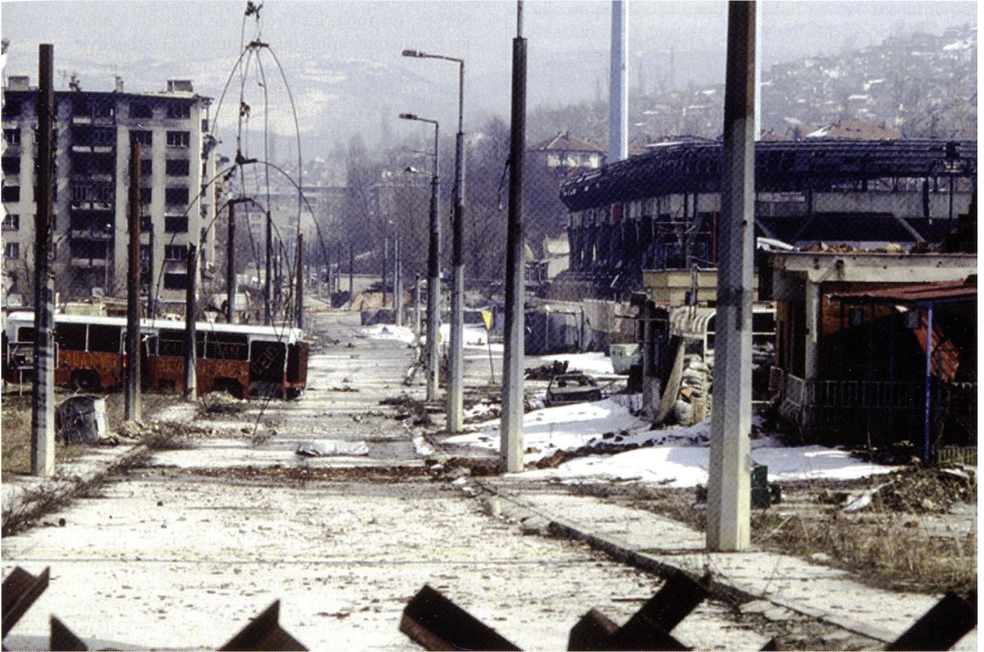
«Sniper Alley» à l'Ouest de Sarajevo. Les barricades et les nombreux accrochages s'expliquent parce que cet axe, qui relie l'aéroport au centre-ville historique, passe devant le quartier orthodoxe de Grabavitzka.