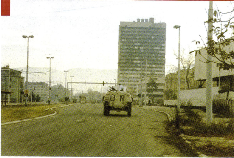
Un véhicule de transport de troupes blindé Sisu du NORLOGB dans l'Ouest de Sarajevo, entre l'aéroport et le centre-ville.