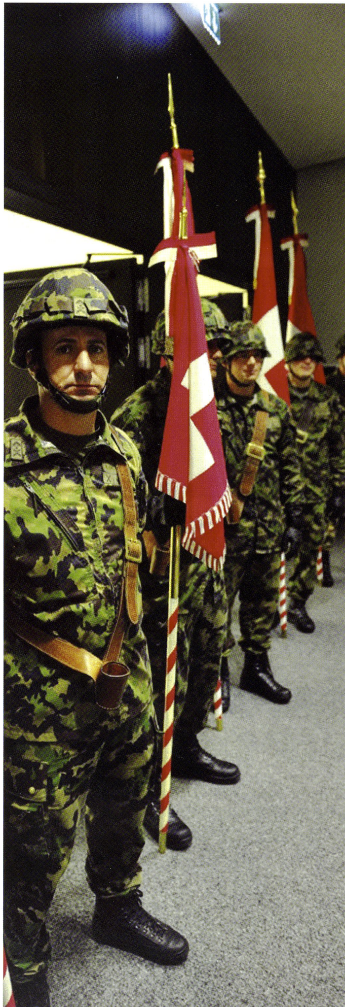
Les étendards de la région territoriale 1, à Interlaken le 12 octobre 2012.

Les objectifs du divisionnaire Favre sont les suivants : garantir la capacité à l'engagement, garantir la conduite des engagements subsidiaires, assurer l'aide en cas de catastrophe, poursuivre les entraînements dans les cadres aéroportuaires – dès aujourd'hui également à Belp Le bataillon acc 34 sera engagé au profit du canton du Valais. Le bataillon acc 1 sera entraîné à Genève au mois de mai, avec notamment l'exercice INTER 13 (20-24.05.2013) testant l'interopérabilité franco-suisse. Le bataillon d'infanterie de montagne 30 sera engagé