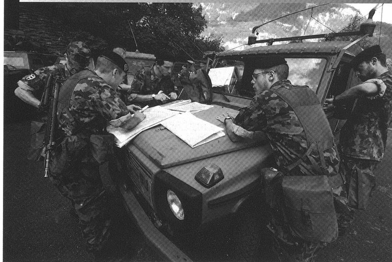
Donnée d'ordre du chef de section exploration. Aéródrome de Mollis (GL), 2009.