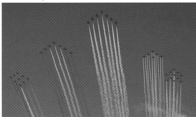
La Patrouille des Patrouilles regroupant les plus prestigieuses formations avaient offert un bouquet final majestueux à Air 04.