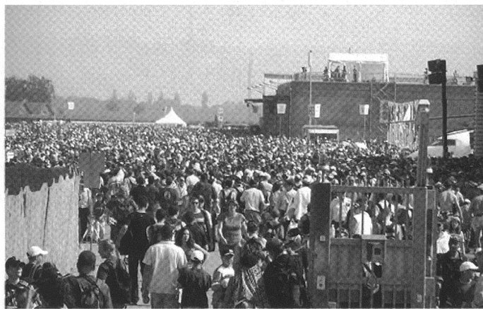
Même dans leur plus beaux rêves, les organisateurs n'osaient imaginer une telle affluence pour Air 04.