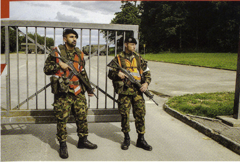
EM bat chars 17