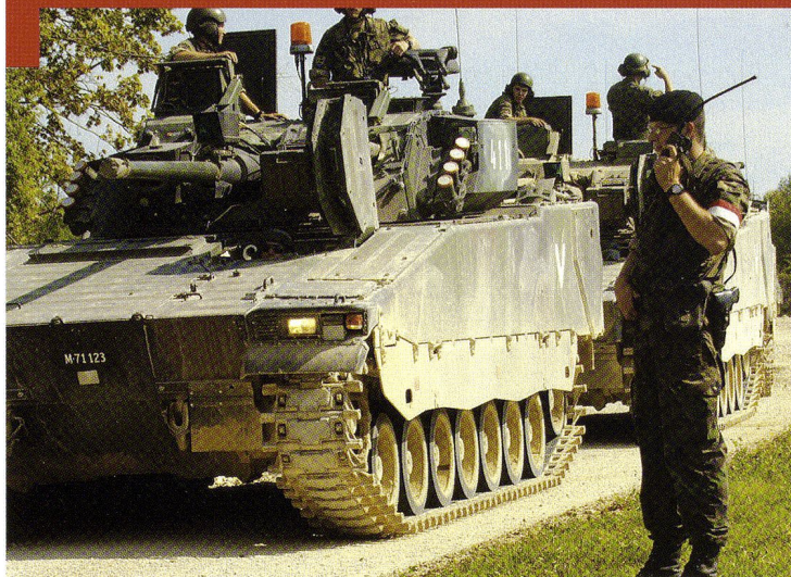
EM Bat chars 17