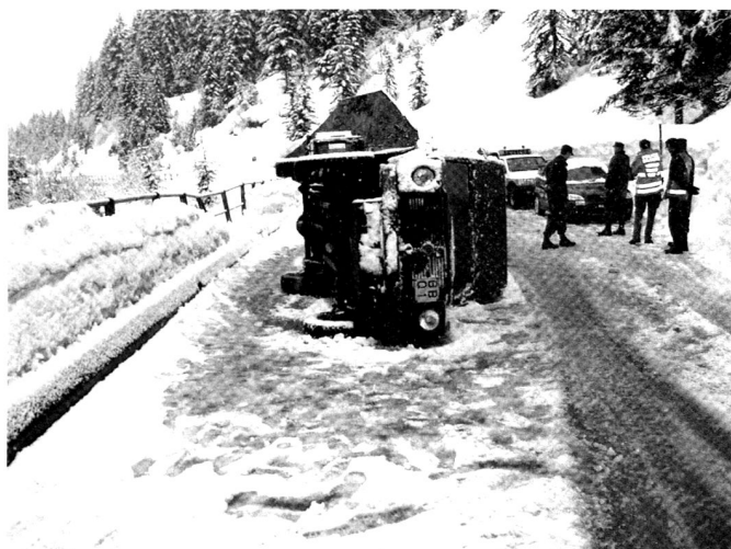
Accident de la circulation survenu le 28 mars 2006 sur la place d'armes de l'Hongrin (Vaud), sans blessé. Le Juge d'instruction a adressé son rapport au edf en proposant un règlement disciplinaire.

Pour illustrer les tâches et les compétences du juge d'instruction militaire, prenons deux exemples inspirés de la pratique judiciaire actuelle, en Suisse et à l'étranger : celui d'un vol de munitions et d'intensificateurs de lumières résiduelles (ILR) durant un service d'instruction en formation (SIF) et celui d'une divulgation de secrets militaires à des tiers. Lorsque le suspect est un militaire en service au sein de la troupe au moment de la découverte des infractions, le commandant d'école si le militaire est en formation, ou le commandant de bataillon si l'infraction a lieu lors d'un SIF, peut interroger le militaire concerné avant d'ordonner une enquête pénale. Ses déclarations peuvent être consignées dans un procès-verbal. Le suspect peut faire l'objet d'une détention provisoire sur l'ordre d'un supérieur pour une durée qui ne peut excéder 24 heures à compter de l'appréhension. Lorsque les actes délictueux ont été commis en-dehors du service, il appartient à l'auditeur en chef d'ordonner l'ouverture d'une enquête pénale. L'intervention du juge d'instruction. Dans l'un et l'autre cas de figure, le commandant d'école, de bataillon ou l'auditeur en chef doit faire appel au juge d'instruction militaire en lui adressant à cette fin une ordonnance d'enquête. En fonction des circonstances, les mesures prises peuvent être les suivantes :