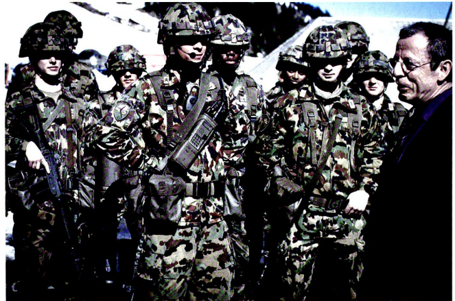
La «Une de fer» accueille le président du Grand Conseil vaudois.

Regardez aussi la situation dans les différents corps de police. Les exigences lors des recrutements sont sans cesse à la baisse. Voulons-nous la même chose pour notre armée ?