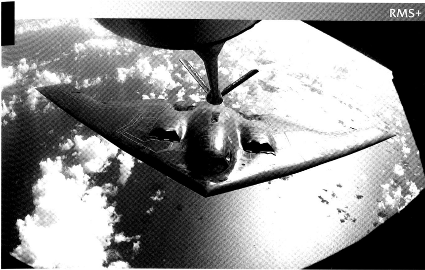
Des bombardiers stratégiques furtifs américain B2 Spirit pré-positionnés dans le Pacifique, pour palier à la menace Nord Coréenne? Ou pour mener une première frappe? Info ou intox?