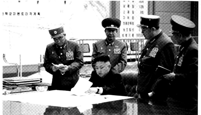
Vrais ou faux missiles stratégiques nord-coréens ? Intention de les utiliser ou non ?

agissent sous les oripeaux bien commodes de la liberté d'expression et alimentent un feuilleton tapageur auquel le prétexte démocratique confère sa légitimité.