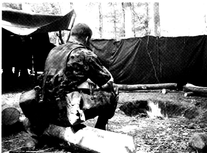
Le passage de la vie civile –individualiste et techno-centrée- à la vie en communauté est parfois complexe à gérer... mais nécessaire.