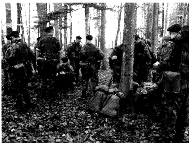
La confiance mutuelle et la responsabilité personnelle sont nécessaires afin de maîtriser des armes et des appareils complexes et dangereux.