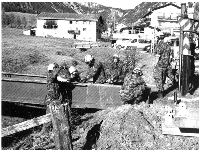
L'armée accomplit l'essentiel de ses tâches, en temps de paix, au profit des collectivités – cantons et communes.