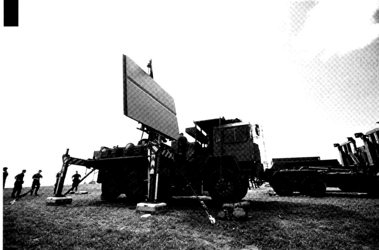
L'élément central du système TAFLIR : l'antenne radar.