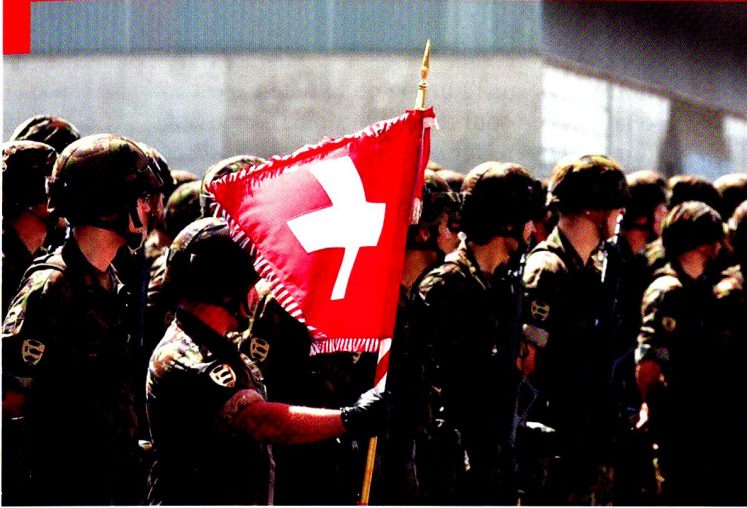
Prise de l'étendard du bataillon de chars 17 à Bure le 15.08.2011.