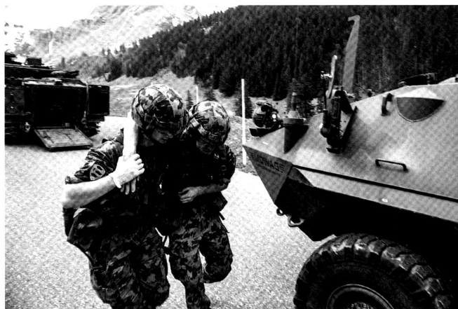
Mise à couvert et évaluation du patient par les san U..

NB : Précisons que les san U sont ordinairement incorporés directement dans les unités combattantes. Dans un bat chars, chaque cp chars et gren chars en compte 4, avec un char sanitaire Piranha 6x6. Durant le SIF, ils ont été rassemblés au sein de la section sanitaire de la cp log chars 17, mais avec un seul véhicule.