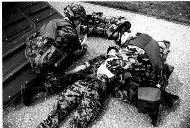
Préparation du patient pour le transport.