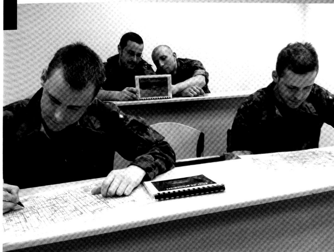
Cp chars 17/2