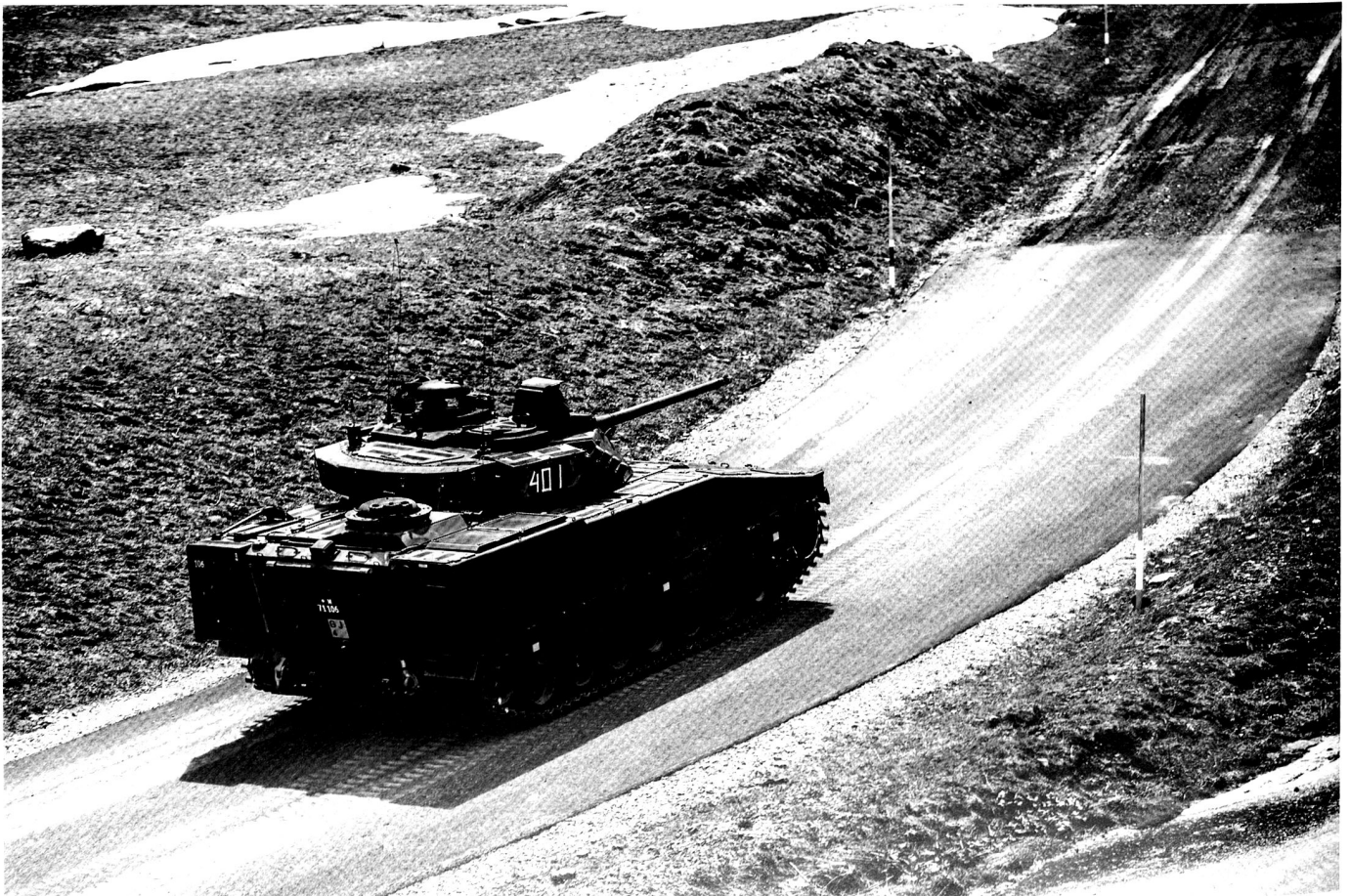
Le chars gren 2000 combattant sa cible avec son canon 30mm.