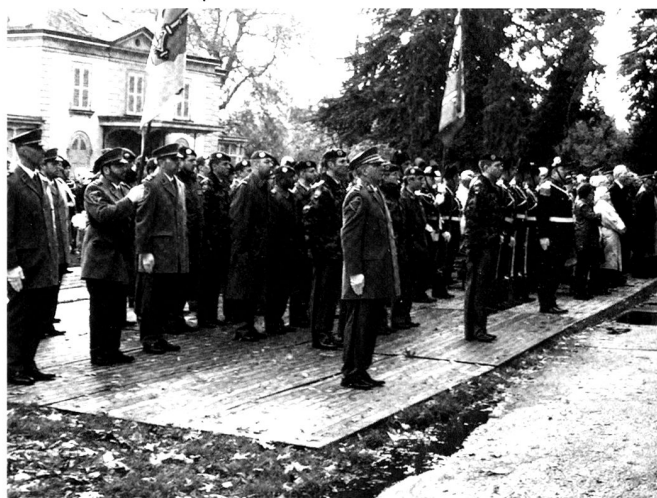
Cérémonie de Mon-Repos.