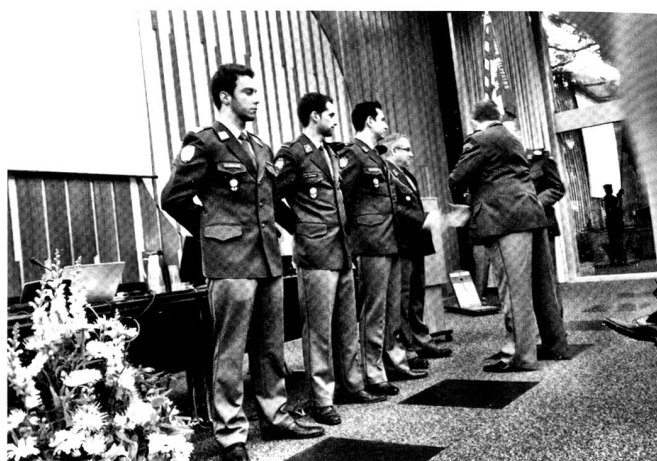
Le président félicite les nouveaux membres.