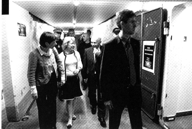
Visite du Chef du DDPS et des chefs des Départements cantonaux de la Sécurité romands, à l'Académie de Police de Savatan.