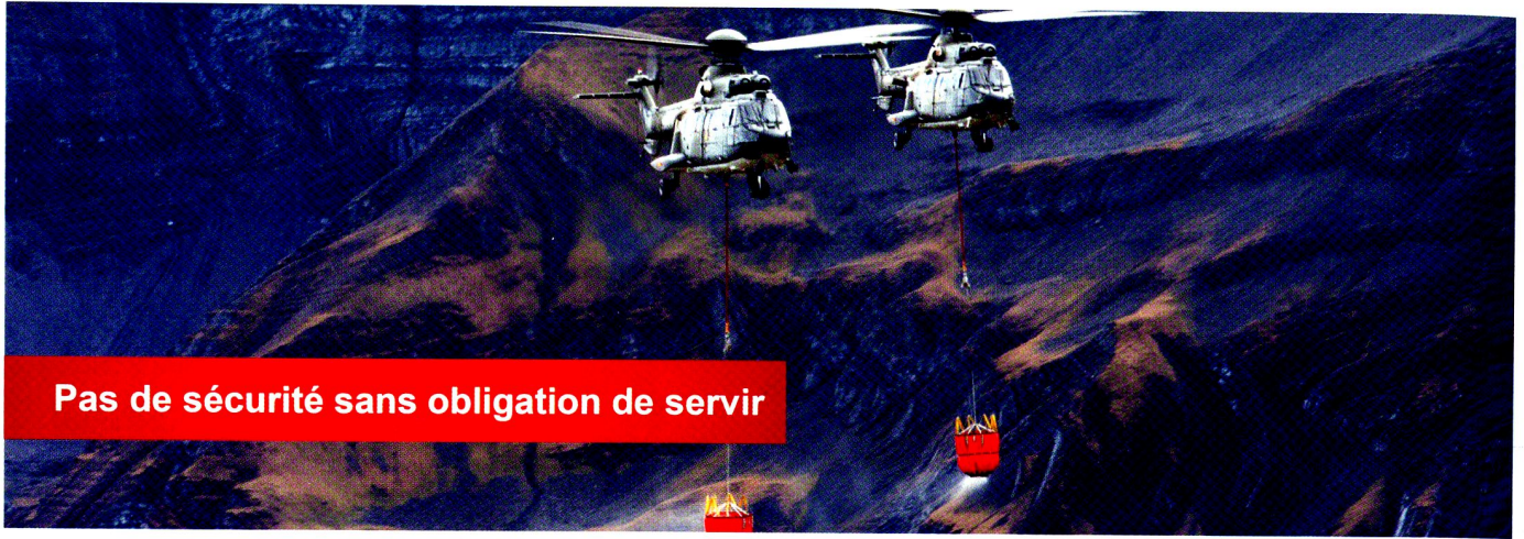
Pas de sécurité sans obligation de servir