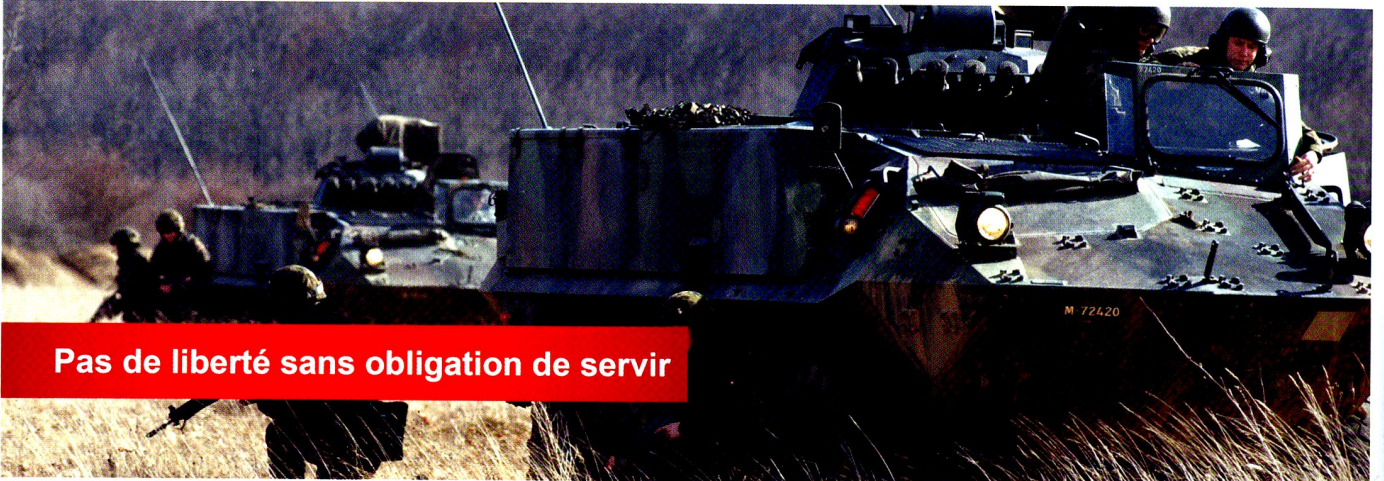
Pas de liberté sans obligation de servir