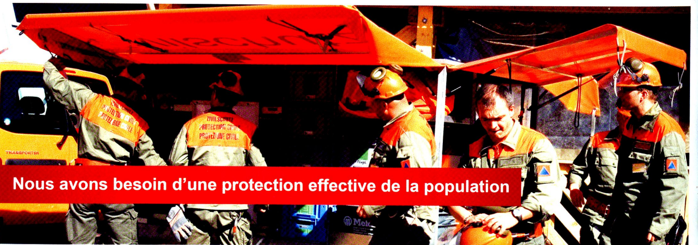
Nous avons besoin d'une protection effective de la population