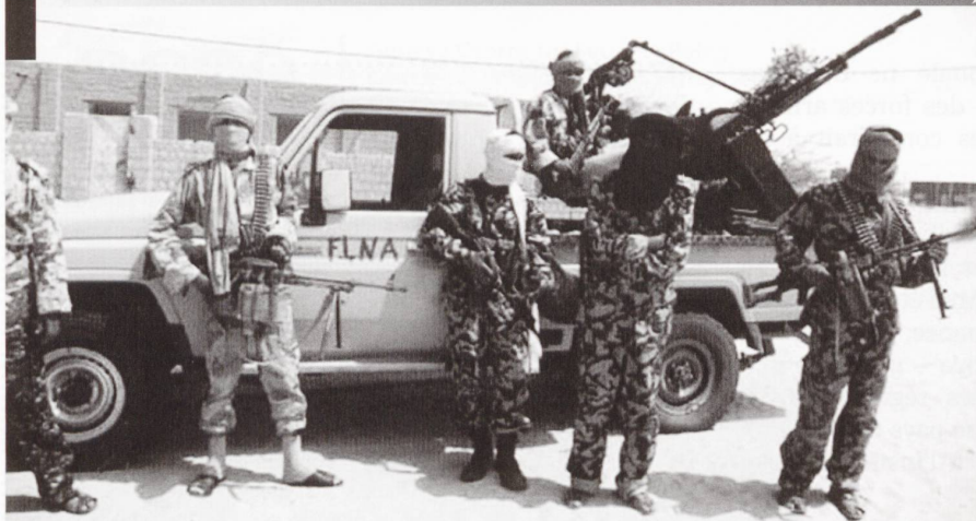
Ci-contre et ci-dessous : Combattants du MNLA, constitués de groupes islamistes algériens mêlés aux groupes armés touaregs. Cette coalition contre nature est parvenue, en quelques mois, à chasser les forces gouvernementales du Nord du Mali, à proclamer un Etat autonome –l'Azawad– et à vaincre les forces armées nationales, provoquant ainsi un coup d'Etat et faisant vaciller le pouvoir du nouveau gouvernement puchiste.