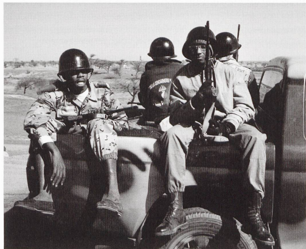
L'armée malienne (ci-dessous), équipée et entraînée par les forces américaines, est parvenue à prendre le contrôle du sud du pays, mais confrontés à des mercenaires aguerris, a été rapidement mise en déroute.

Paradoxalement, alors que l'on entend surtout parler de l'AQMI dans les médias, les acteurs qui mériteraient plus d'attention sont Ansar Dine et le MUJAO. En effet, comme l'indique Mehdi Taje, « l'extrémisme islamiste s'affirme de plus en plus comme ultime refuge face aux frustrations économiques, sociales et politiques et comme alternative au modèle démocratique occidental rejeté par les populations » 10