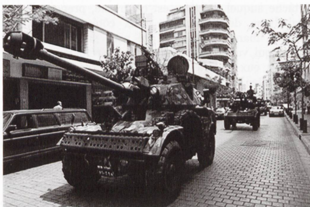
Déplacement de blindés et de troupes dans les rues de Beirut. Ce type d'intervention est malheureusement fréquent et en augmentation constante.