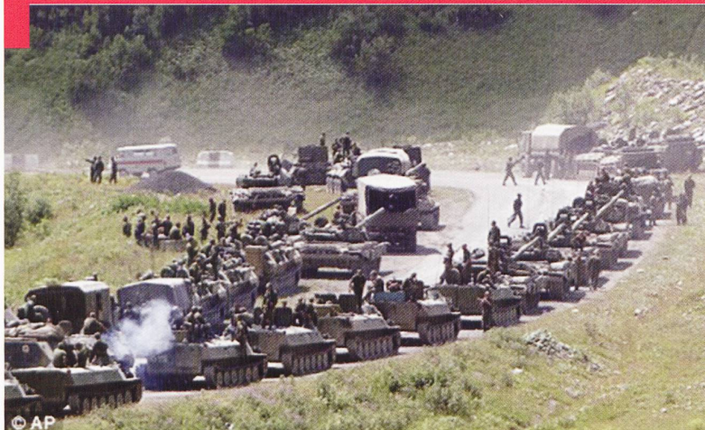
Une colonne de blindés russes en Géorgie, 2008.