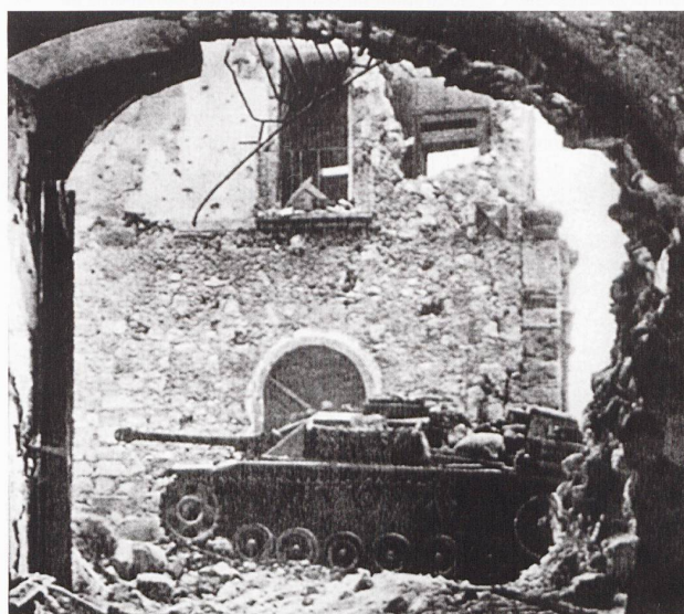
Un StuG 40 appartenant à une unité de parachutistes se cache dans les ruines de Monte Cassino, au sud de Rome, durant l'été 1944.