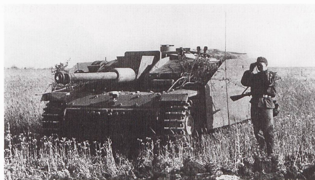
Cette vue d'un StuG III Ausf. F sur le front de l'Est montre bien ses qualités : faible hauteur, fort blindage et tube long.