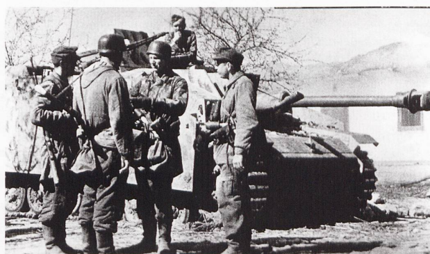
Un StuG 40 Ausf. G appartenant à la Fallschirm-Sturmgeschütz-Brigade 12 à Wilkowschken, Russie.