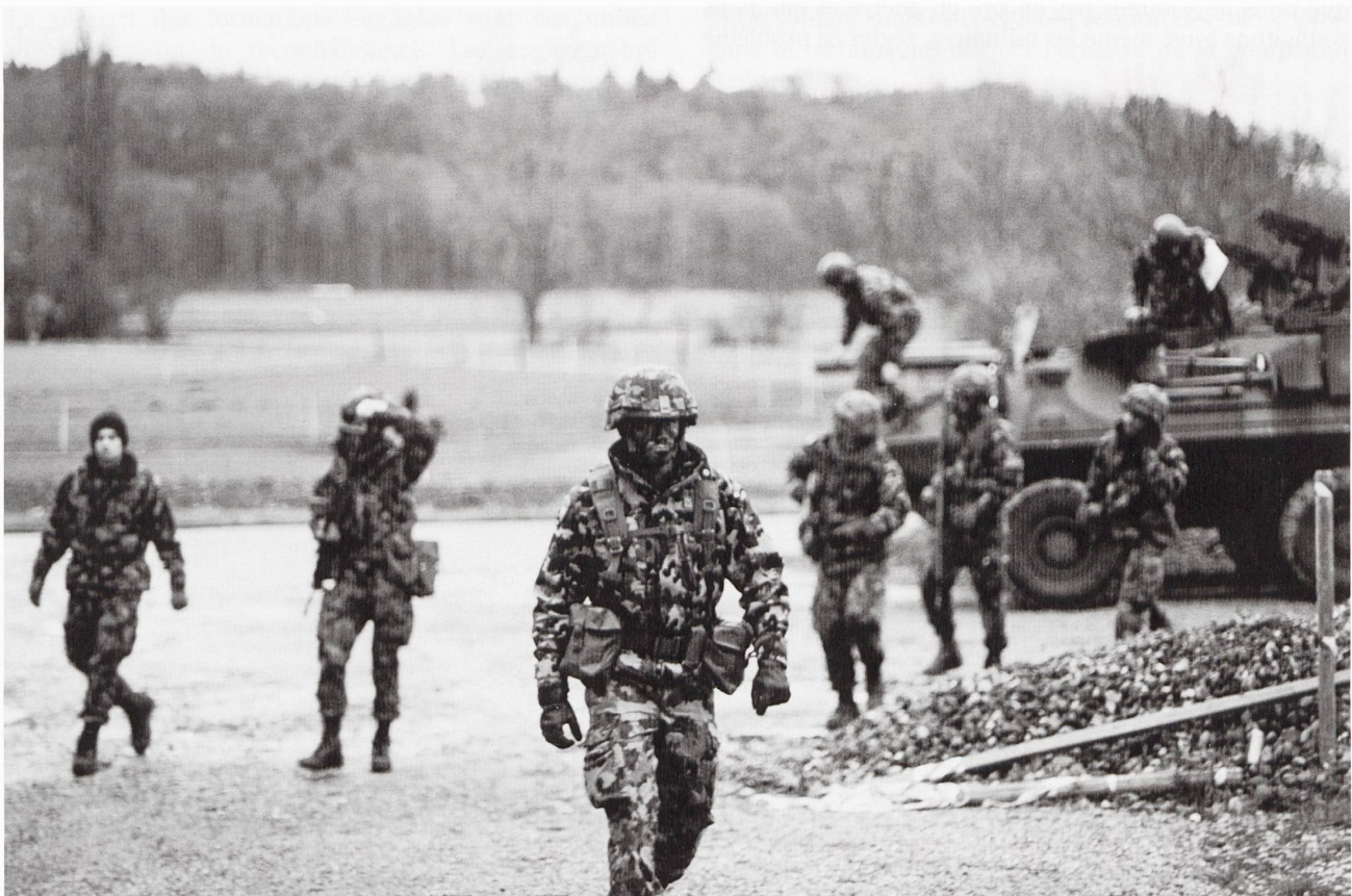
Un officier d'état-major est escorté vers l'EAVC du bat expl 2.

Les conclusions de cet exercice vous en disent long sur nos échanges :